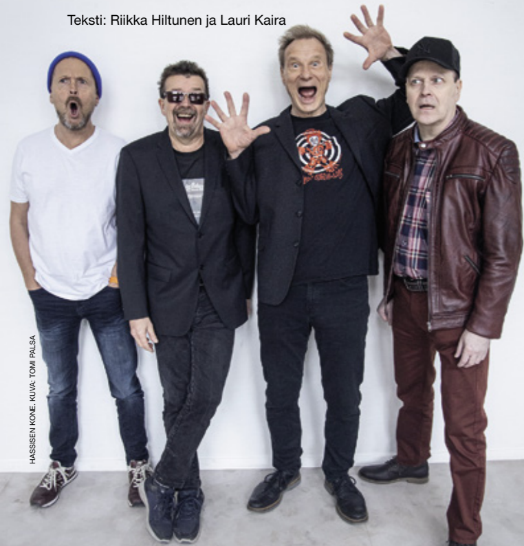
HASSISEN KONE.