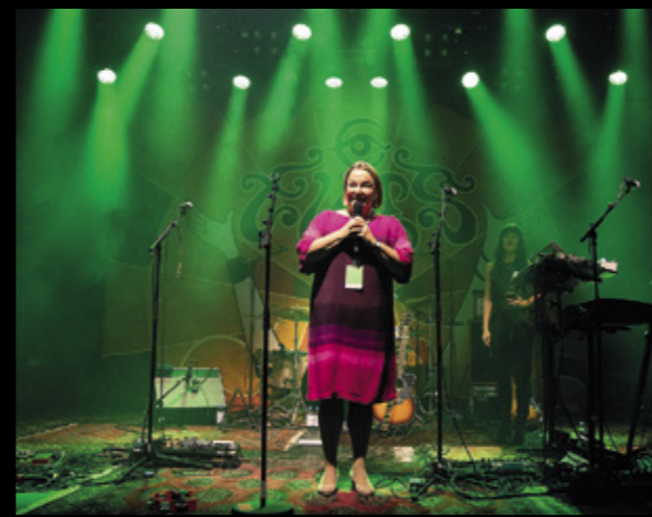
Gramexin hallituksen puheenjohtaja Tuija Brax puhumassa.