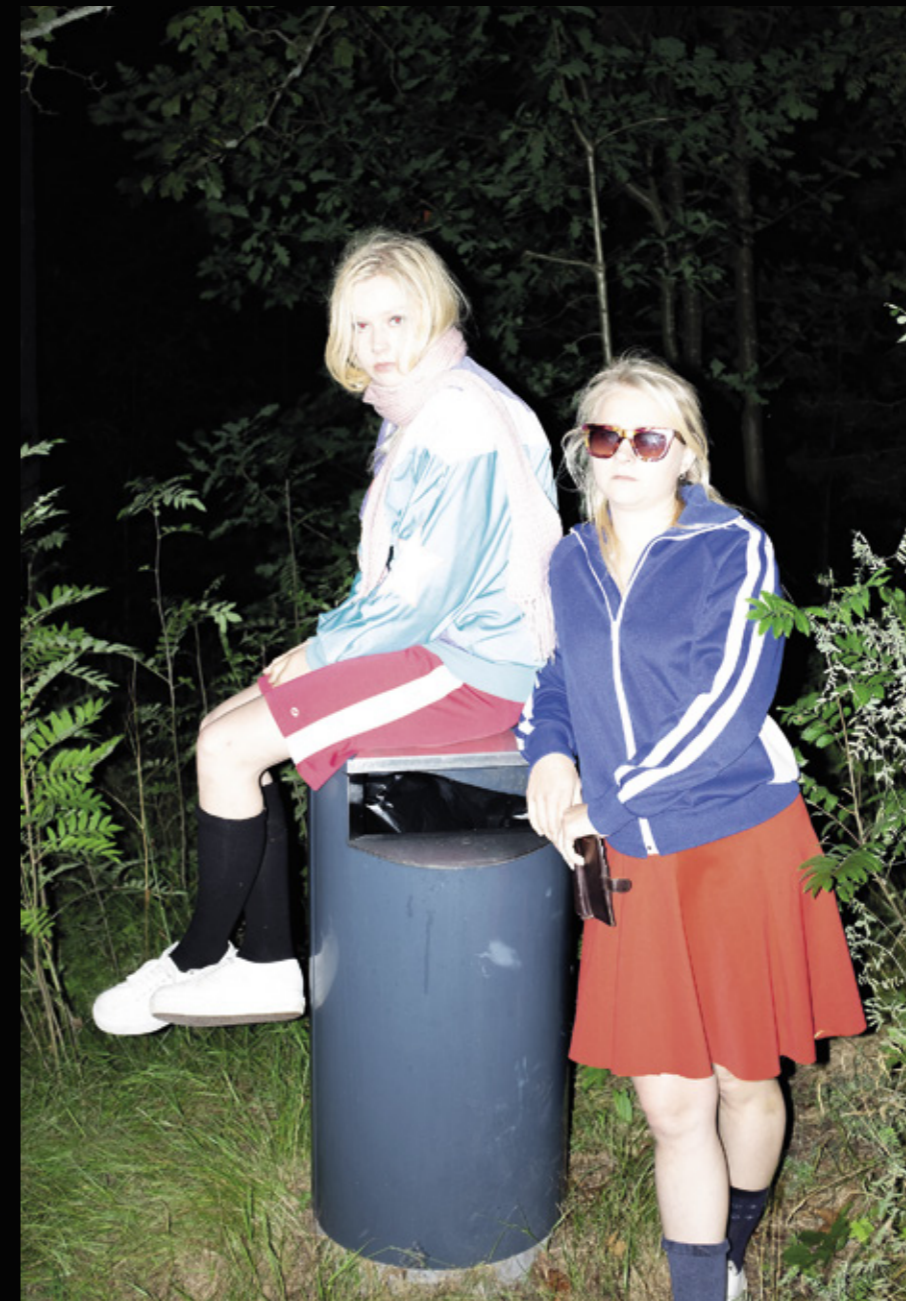
Maustetyttöjen Anna ja Kaisa Karjalaisen syksyn kalenteri on ollut täynnä keikkoja ympäri Suomea.

”Koitetaan vain tehdä mahdollisimman hyviä kappaleita ja toteuttaa ne heikon osaamisemme puitteissa parhaamme mukaan.”