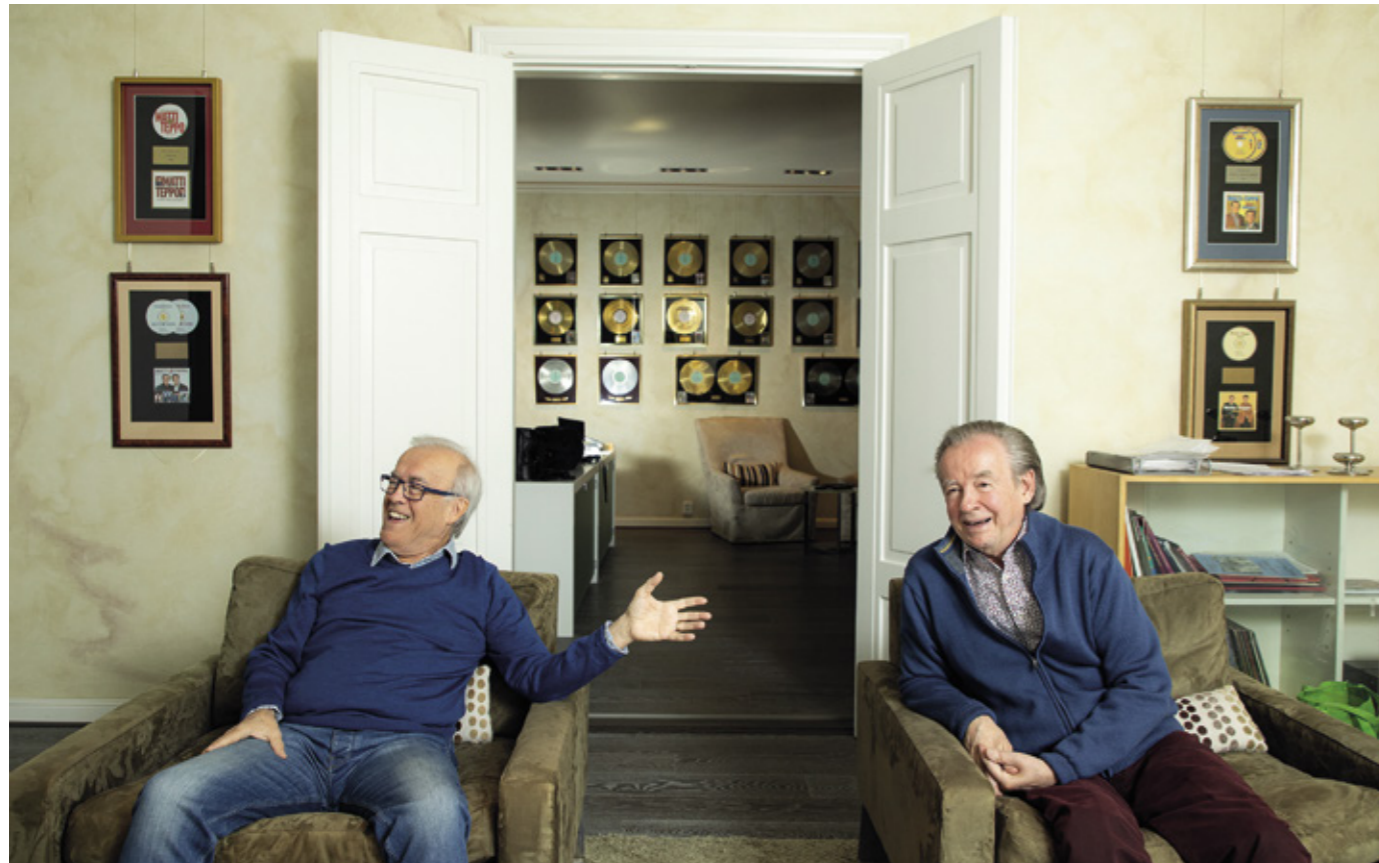
Matilla (vas.) ja Tepolla on takanaan yli 50 vuotta kestänyt ura. ”Jotenkin se energia on säilynyt. Kyllä tätä hommaa on edelleen hirveän kivaa tehdä”, Teppo sanoo.

”Teppo sanoi jo kaksikymmentä vuotta sitten, että haluaa lopettaa.”