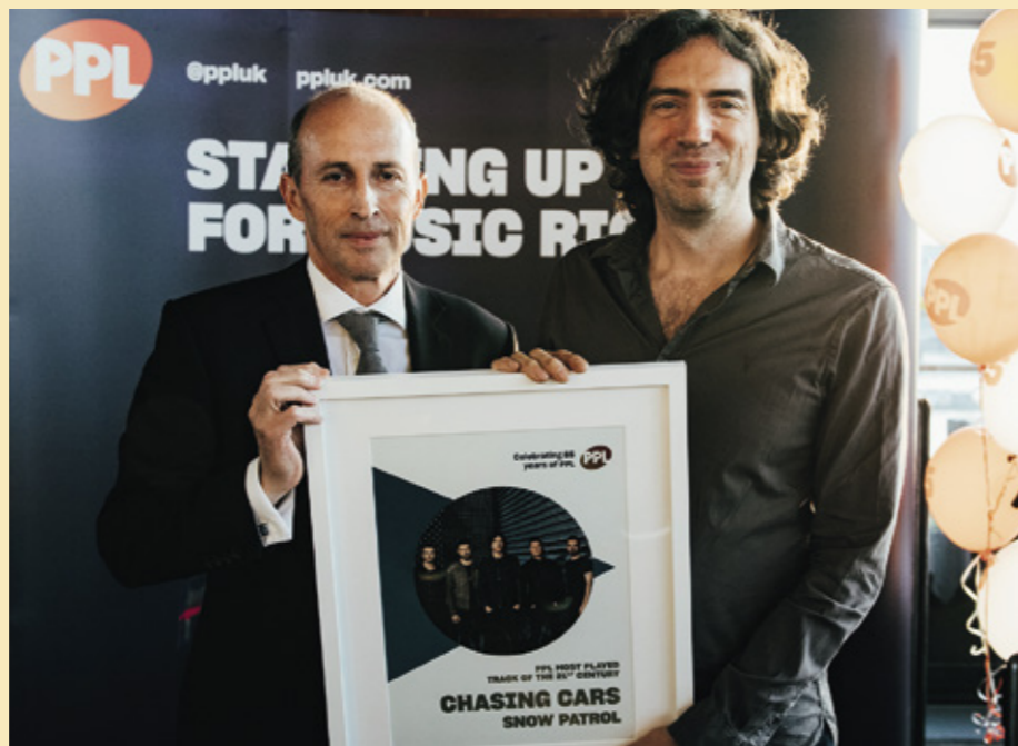
PPL:n vuosijuhlissa palkittiin Snow Patrolin ”Chasing Cars” Ison-Britannian soitetuimpana kappaleena 2000-luvulla. Palkinnon vastaanotti yhtyeen laulaja Gary Lightbody.

PPL tekee yhteistyötä muiden maiden tekijänoikeusjärjestöjen sekä muusikkojen ja levy-yhtiöiden järjestöjen kanssa.