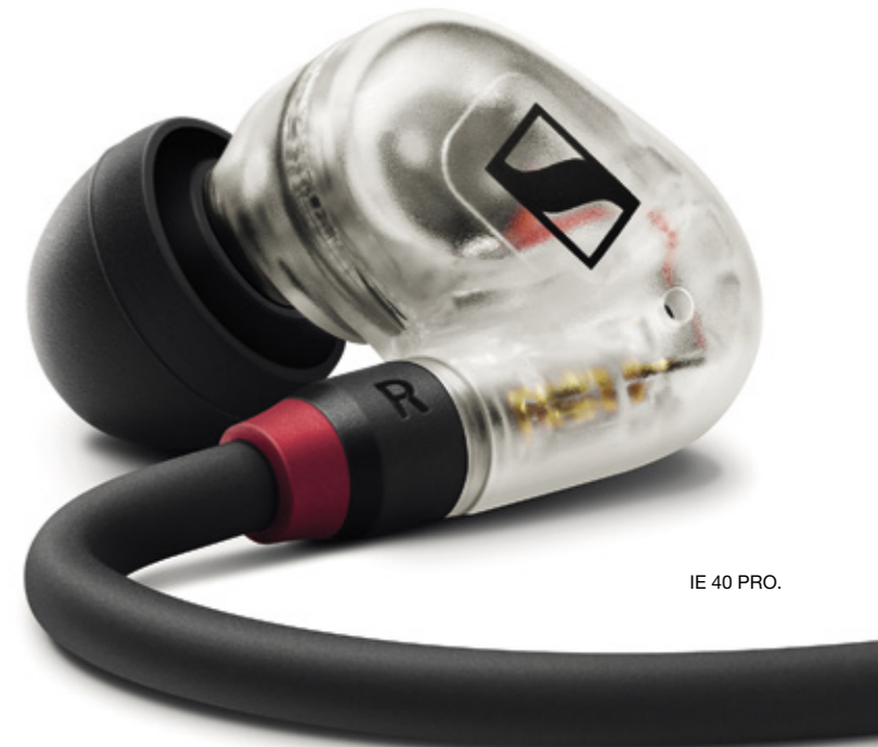
IE 40 PRO.

Valmistaja kertoo kiinnittäneensä erityistä huomiota keikkakäytössä kriittisimpään kohtaan eli johtoliitäntään, joka on umpioitu turvallisesti kuulokkeen sisään.