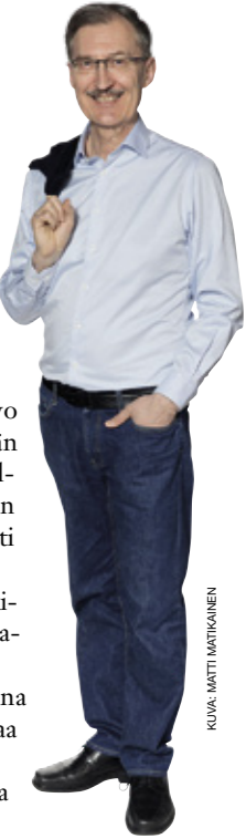
KUVA: MATTI MATIKAINEN

PS. Toivotamme lukijoillemme hyvää joulua ja musiikkipitoista uutta vuotta!