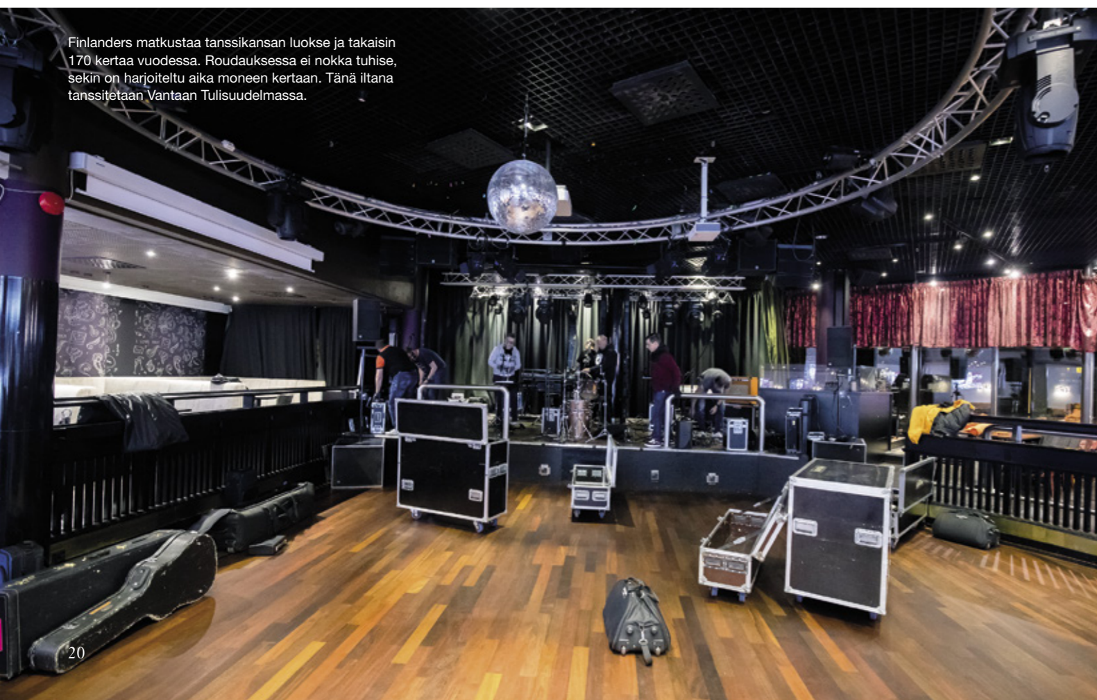
Finlanders matkustaa tanssikansan luokse ja takaisin 170 kertaa vuodessa. Roudauksessa ei nokka tuhise, sekäin on harjoiteltu aika moneen kertaan. Tänä iltana tanssitetään Vantaan Tulisuu-delmassa.