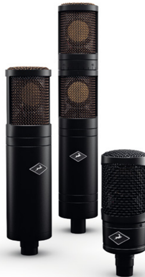
Edge Solo, Edge Duo ja Edge Quadro.