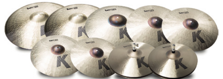
K Sweet -sarja.

Sarjan 15- ja 16-tuumaisiin hi-hateihin on yhdistetty hyvin ohutta yläsymbaalia selvästi raskaampaan alasympaaliin. Kuvat ovat sorvaamatotomat, kuten myös aksentisympaaleissa, joita on tarjolla laaja kattaus tuuman portain 16:sta aina