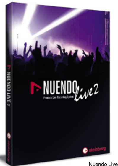
Nuendo Live 2.