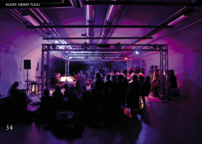
Vuonna 2016 Kallion nykymusiikkipäivät pidettiin Vapaan taiteen tilassa. Se on Katri Valan puiston väestönsuojassa Helsingin Sörnäisissä.