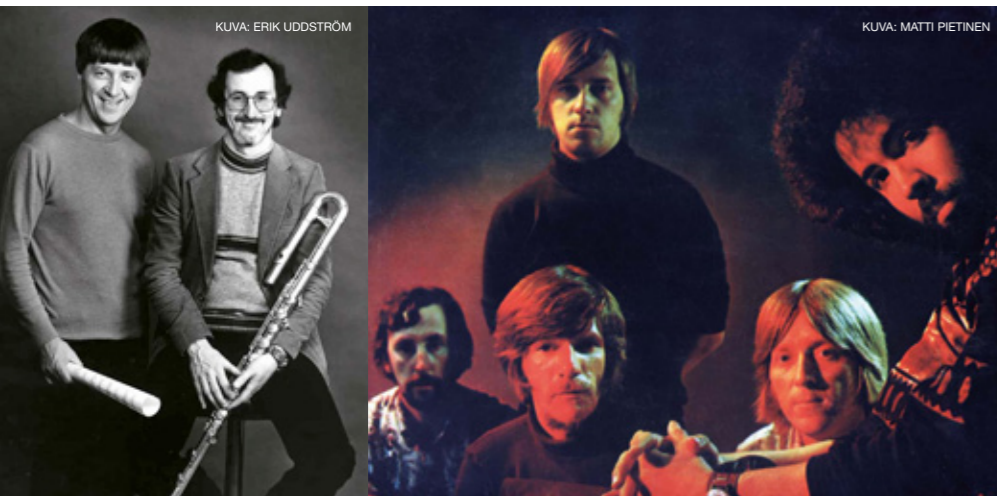
Heikki Sarmanto ja Juhani Aaltonen vuonna 1990 (vasen kuva) ja Serious Music Ensemble vuonna 1971.