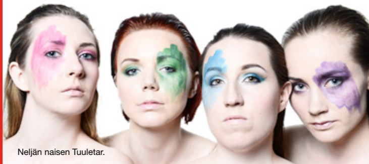
Neljän naisen Tuuletar.

vuoden Womexissa Tuuletar esiintyi Norjan NRK:n ja Iso-Britannian BBC:n tarjoamassa radiokonsertissa. Yhtyeen kesäkuussa ilmestynyt esikoisalbumi Tules Maas Vedes Taivaal nousi Euroopan World Music Charts ja maailmanlaajuisen Transglobal World Music Charts -listojen kärkikymmenikköön.