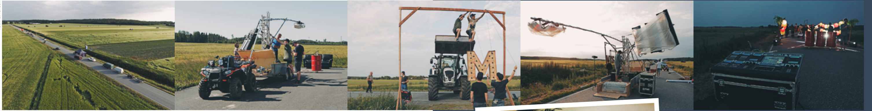
Taco hej -videon kuvausta varten suljettiin yhdeksi heinäkuun illaksi ja yöksi pätkä maantietä Vöyrillä. Mukana videon teossa oli 40–50 ihmistä.