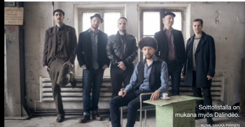
Soittolistalla on mukana myös Dalindéo.

Sivustolta löytyy taustatietoa yhtyeistä ja artisteista. Soittolista on käytettävissä suoratoistopalveluissa Spotify ja Apple Music.