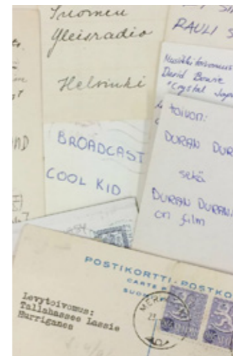
Yleisradiolle tullutta toivepostia.

Yle luovutti Lauantain toivotut levyt -postikokoelmansa 1935–2013 Japalle. Yhtiö sai siitä Vuoden arkistoteko -palkinnon 2016.