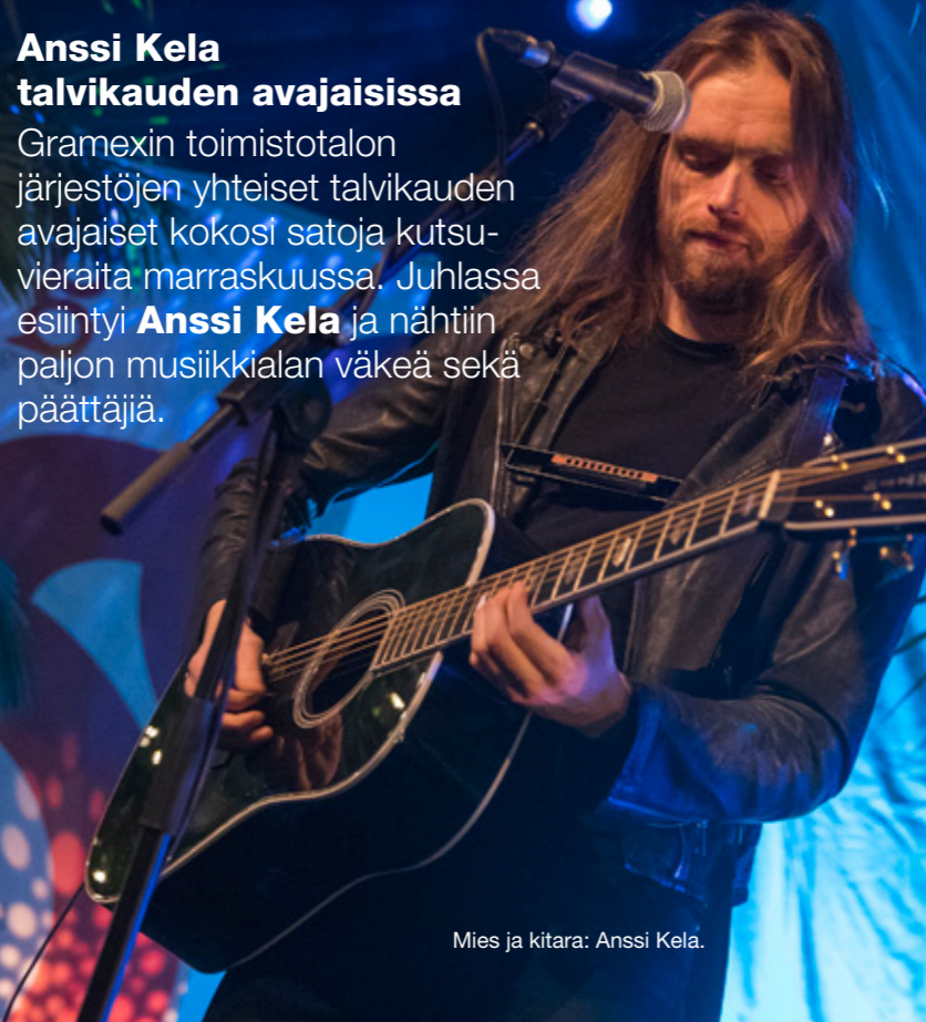
Mies ja kitara: Anssi Kela.