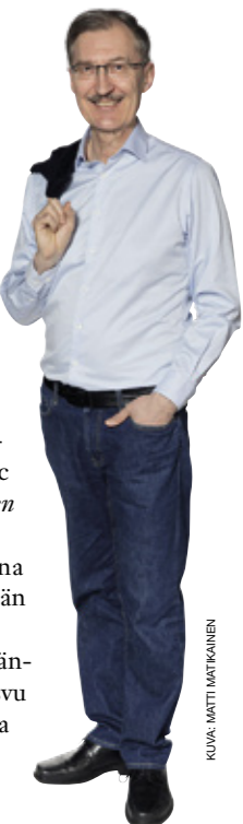
KUVA: MATTI MATIKAINEN