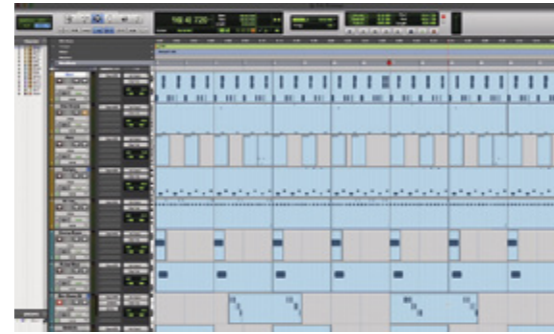
Pro Tools 2019.