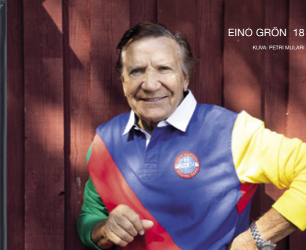
HYVITYSMAKSU VUORISTORADASSA 26