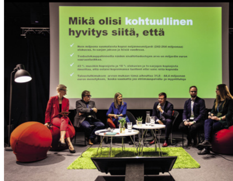
Gramex ja Teosto järjestivät suuren suosion saaneen poliittisten vaikuttajien paneelikeskustelun myös viime vuonna.