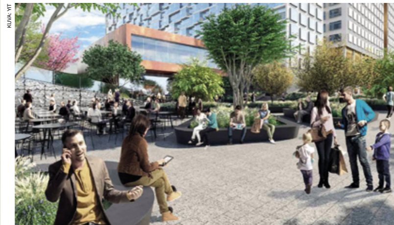
Havainnekuva näyttää Musiikkimuseon Pasilan uusien jättitalojen välissä.