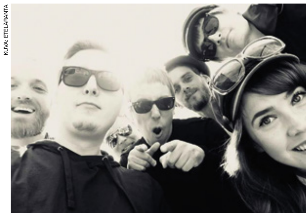
Etelärannassa on kaikkiaan seitsemän jäsentä.

”Olemme matkalla kohti huippua. Tällä hetkellä keskenämme kävelen, mutta tilaamamme bussi saapuu pian ja helpottaa matkaa”, Sarkkinen määrittelee. ●