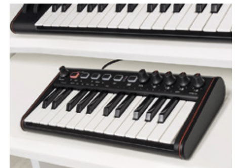
IK iRig Keys 2 Mini.

eebenpuuta, joka on somistettu valmistajalleen tyypillisiin bird-otelautamerkein. 20-nauhaisen kaulan soivaksi pituudeksi eli skaalaksi ilmoitetaan tarkalleen ottaen 24,72 tuumaa. Satula ja tallan kielisilta ovat luuta, ja kokonaisuuden viimeistelevät vuosikertahenkiset virritimet.