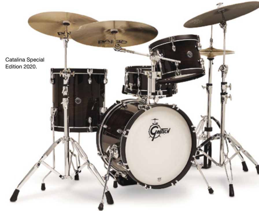
Catalina Special Edition 2020.

Soitin-palstalla esitellään kauden kiinnostavia soitinuuksia ja oheislaitteita. Teksti: Tommi Saarela