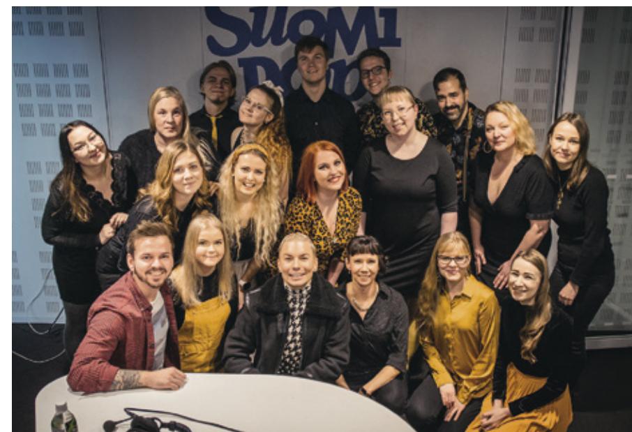
Kuoro pääsi esittämään Antti Tuiskun (edessä keskellä) kappaleen Valittu kansa hänelle itselleen Radio Suomipopilla.