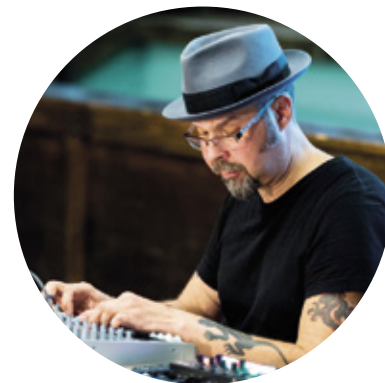
MIKA VAINIO.

Pan Sonic -yhtyeensä lisäksi hän julkaisi musiikkia omalla nimellään sekä eri sooloprojekteina. Vainion ääni-installaatioita on kuultu nykyaikaisen rytmänäyttelyissä Euroopassa ja Pohjois-Amerikassa. Kiasman näyttely on ensimmäinen laaja katsaus Vainion äänitaiteeseen Suomessa. ●