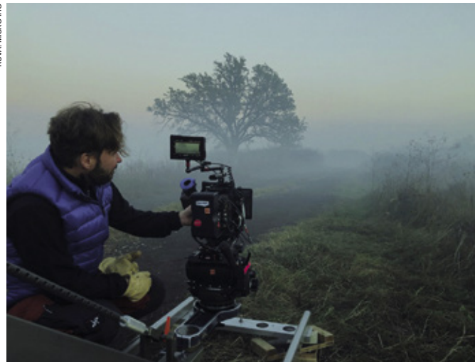
Jean-Noël Mustonen on kuvannut pitkälti toistasataa musiikkivideota.