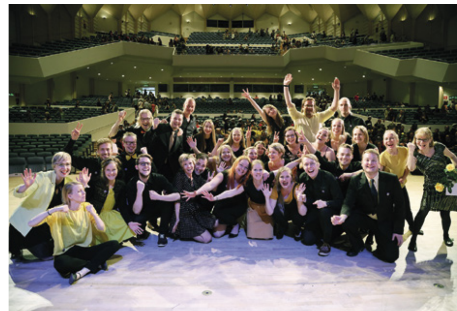
Kesäkuussa 2019 Kipinät sai vokaalimusiikin festivaali Tampereen Sävelen kansainvälisen kuorokatselmuksen korkeimman palkinnon, kolme kultaleimaa.

Suomessa on 3 000 kuoroa. Suomen Laulajain ja Soittajain Liiton Sulasolin kustannusjohtaja Reijo Kekkonen mukaan Suomessa on eniten seka- ja mieskuoroja. Keskimäärin kuorojen koko vaihtelee 15–40 jäsenen välillä. Kokoon voi vaikuttaa se, onko paikkakunnalla tarpeeksi laulajia tai onko paikkakunnalla paljon kuoroja, jotka taistelevat jäsenistä.