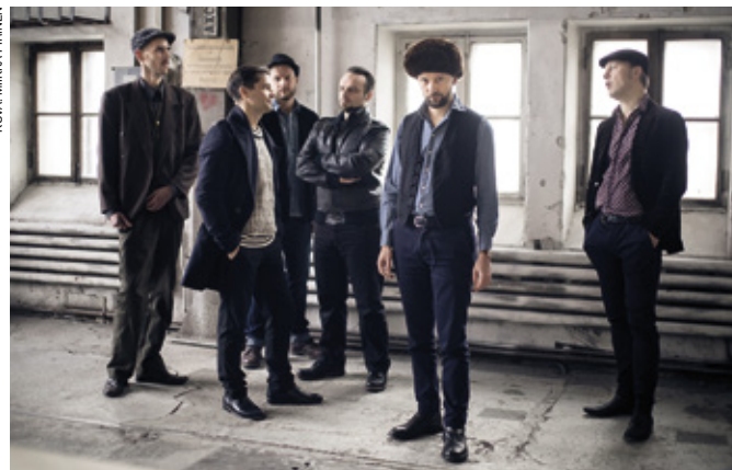
Dalindéo esiintyy joulukuussa Flame Jazz -konsertissa Turun Logomossa.