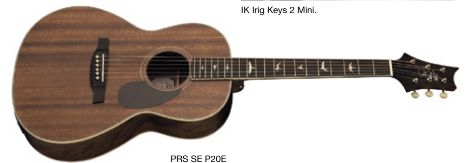
PRS SE P20E