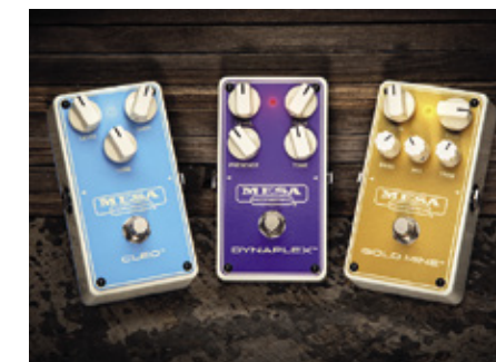
Mesa Boogie Cleo, Dynaplex ja Gold Mine.