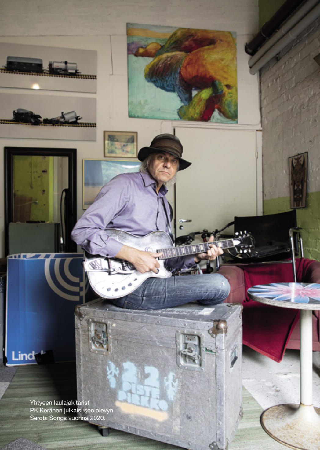
Yhtyeen laulajakitaristi PK Keränen julkaisi soololevyn Serobi Songs vuonna 2020.