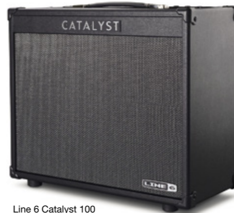
Line 6 Catalyst 100