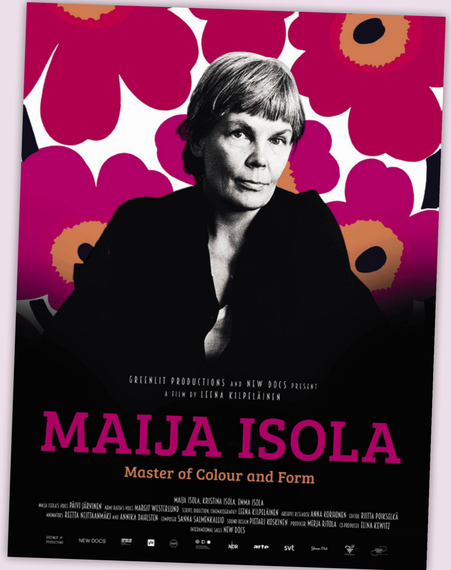
Maija Isola -dokumenttielokuvan julisteessa näkyy taustalla Isolan suunnittelema Unikko-kuosi.