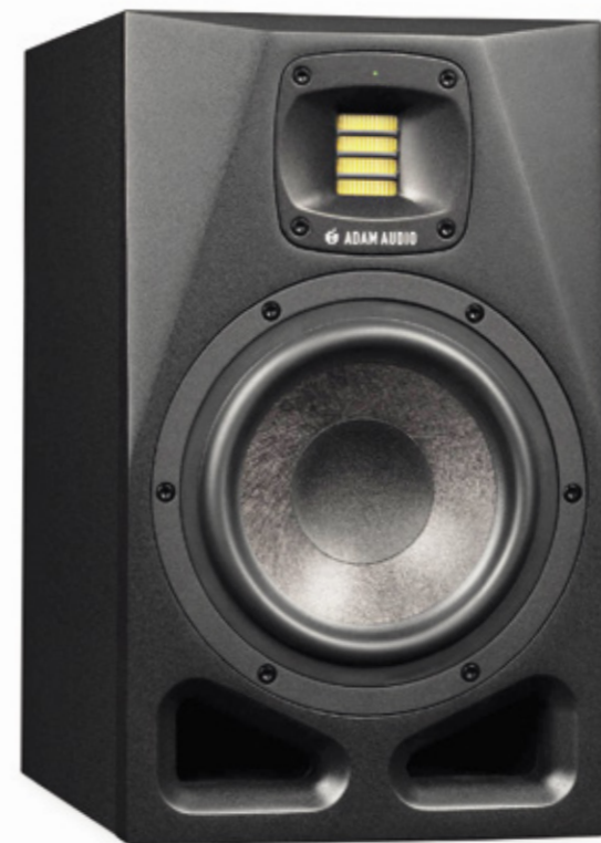
Adam Audio A7V