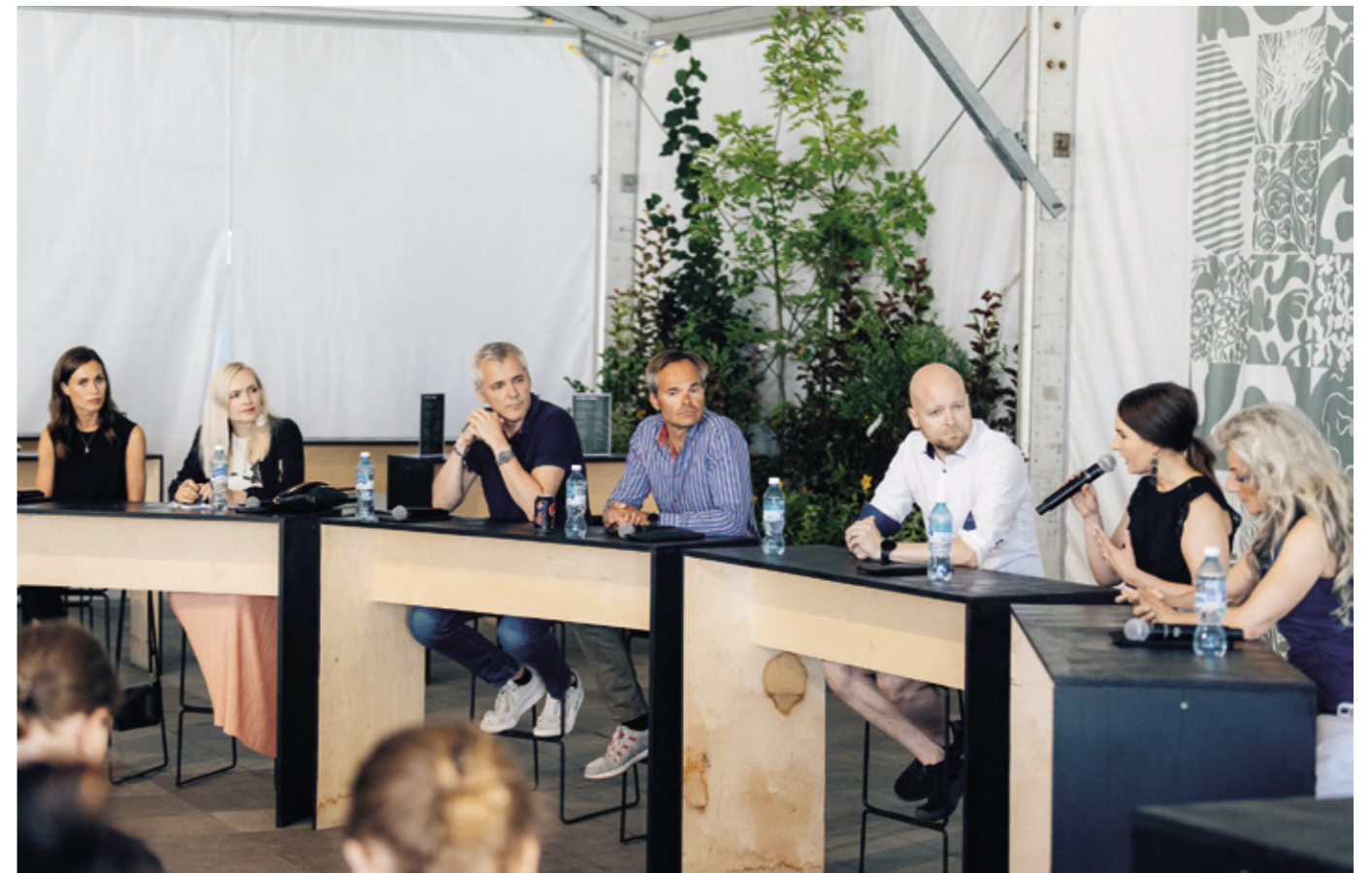
Paneeliin osallistuivat elokuun helteessä Sanna Marin (vas.), Maria Ohisalo, Anders Adlercreutz, Kai Mykkänen, Jussi Saramo, Eeva Kalli ja Ritva "Kike" Elomaa.

P äättäjien paneeli näki melko yksituumaisesti musiikkialan tulevaisuuden valoisaana ja sen tukemisen tärkeänä. Tukea ja hyviä ideoita esitettiin, mutta lupauksia toimiksi jopa näin vaalien lähestyessä tuli nirkoisesti.