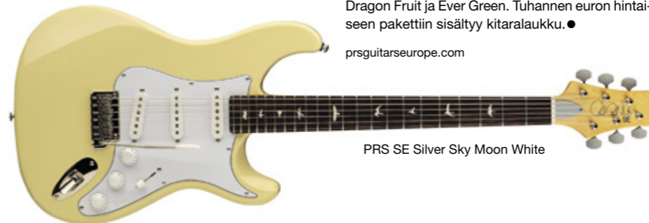
PRS SE Silver Sky Moon White