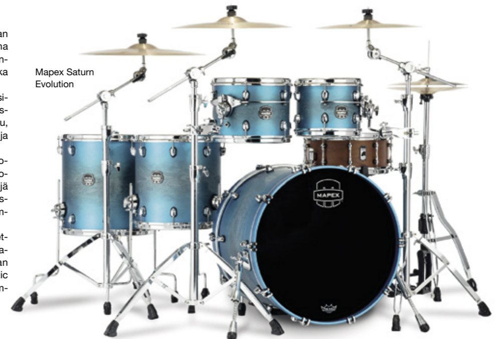
Mapex Saturn Evolution