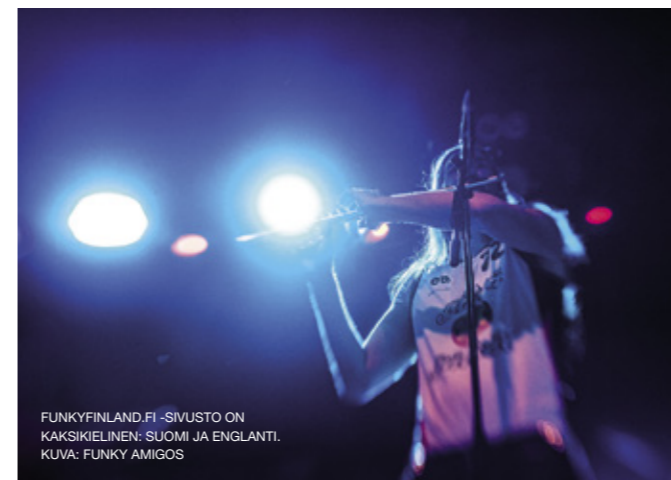
FUNKYFINLAND.FI -SIVUSTO ON KAKSIKIELINEN: SUOMI JA ENGLANTI.