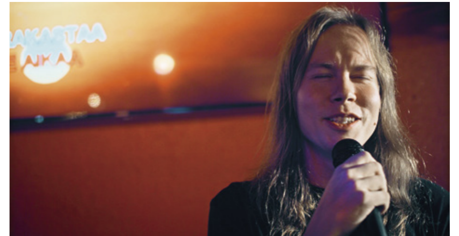
Karaoke saa ujonkin ihmisen lavalle, kuten elokuvassa esiintyvän Tonin.

Karaokeharrastamisessa on Suomessa eri tasoja: yksi tähtää SM-kisoihin, toinen pyrkii vain voittamaan itsensä.