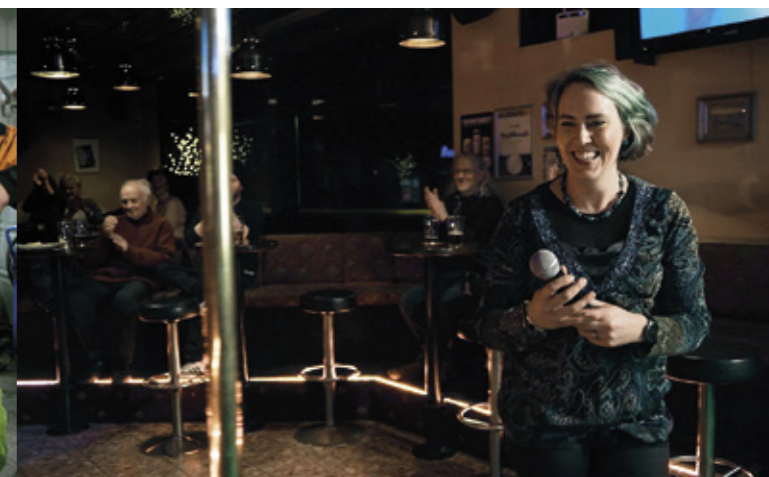
Elokuva todistaa karaoken saavan suomalaiset laulamaan iloistaan ja suruistaan tai rakkaudesta ja sen puuttumisesta sekä huolimatta tuskastaan tai kiviastaan.