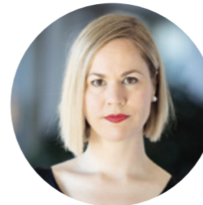
Sosiaali- ja terveysministeri Hanna Sarkkinen (vas.) esitti korjausta taiteilijoiden eläkepulmaan, mutta asia ei ole vielä edennyt.

Gramexin ja Teoston korvauksia kertyy sen mukaan, kun biisejä esitetään. Niitä maksavat esimerkiksi radioasemat ja kauppakeskukset. Ne ovat korvausta teosten käytöstä, eivät palkkaa studio-työstä.