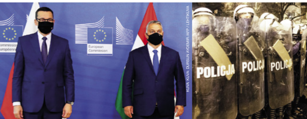
Puolan pääministeri Mateusz Morawiecki (vas.) ja Unkarin pääministeri Viktor Orbán jakavat monessa asiassa samat näkemykset EU:ssa. Puolassa kansalaisten protesteja vastustetaan usein poliisin voimalla.