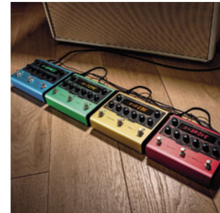
IK Multimedia Amplitube X-Gear