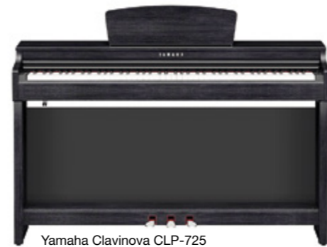
Yamaha Clavinova CLP-725