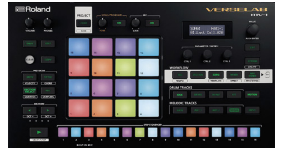
Roland Verselab MV-1