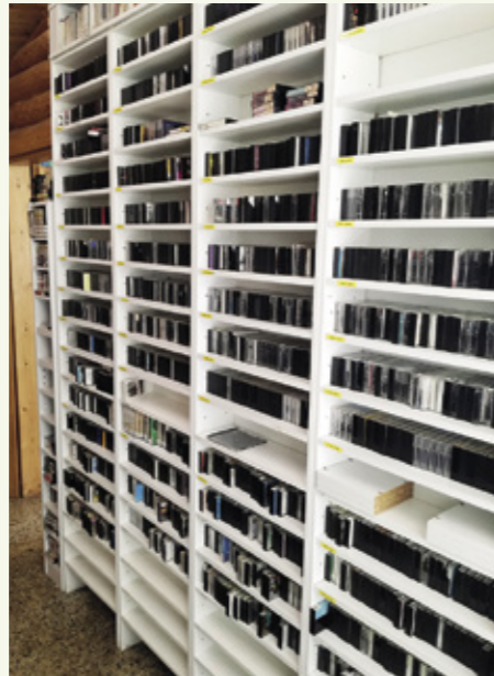
Levystön sataan hyllymetriin mahtuu cd-levyjä, c-kasetteja, lp-levyjä ja savikiekoja.