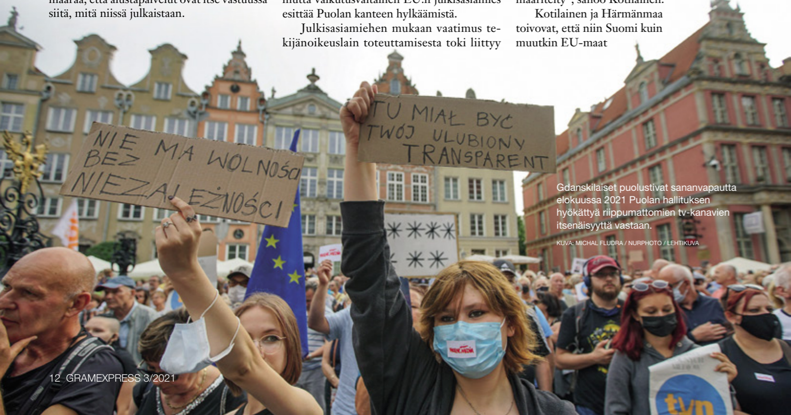
Gdanskilaiset puolustivat sananvapautta elokuussa 2021 Puolan hallituksen hyökättyä riippumattomien tv-kanavien itsenäisyyttä vastaan.

Artikla 17 luo kriteerit, joilla kuluttajien sisältöä vastaanottavat palvelut voidaan jakaa kahteen ryhmään: passiivisiin säilytyspalveluihin ja aktiivisiin julkaisupalveluihin. Passiiviset pilvipalvelut voivat jatkaa niin kuin ennenkin, mutta aktiiviset julkaisupalvelut laitetaan saman tyyppiseen vastuuseen kuin Spotify ja Netflix. Aktiivisen julkaisupalvelun pitää hankkia sivuilla julkaistavaan sisältöön luvat tai – elleivät luvat ole kunnossa – estää sisällön julkaisu. ●