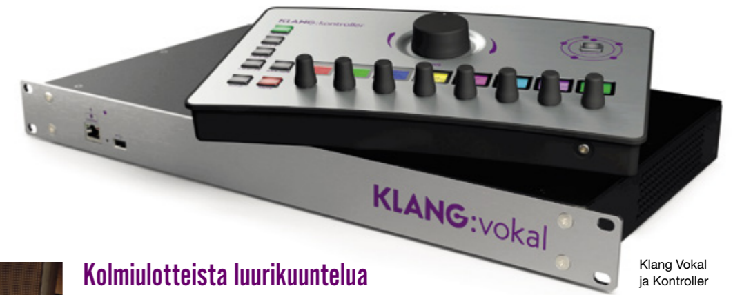
Klang Vokal ja Kontroller

Ääni-palstalla esitellään kauden kiinnostavia ääniteknologian uutuuksia. Teksti: Tommi Saarela