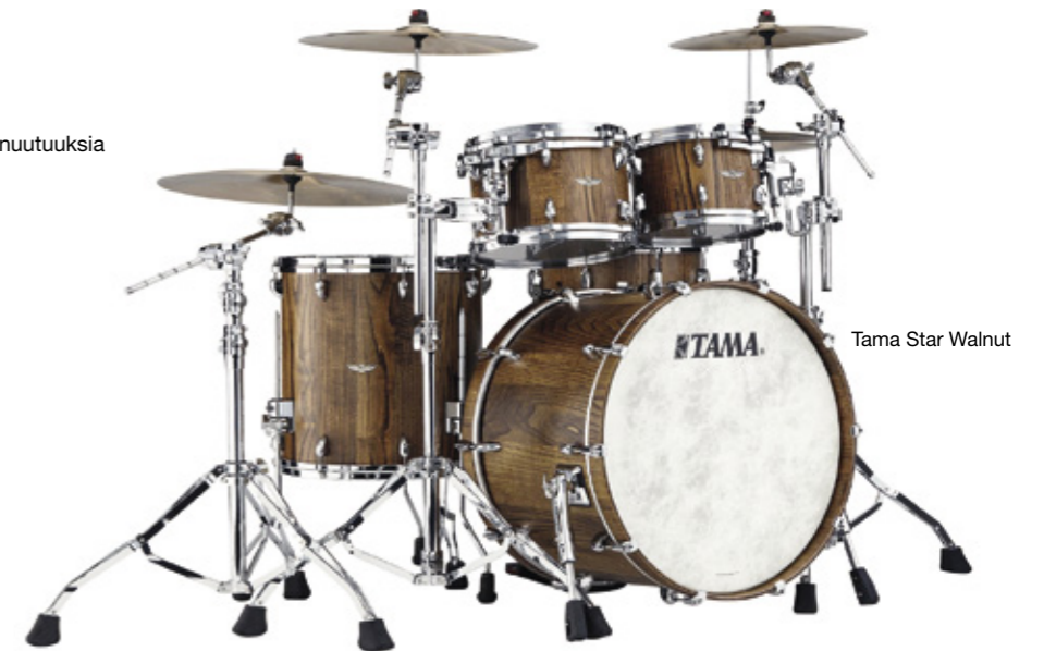
Tama Star Walnut

Soinniltaan perinteisen vaahteran ja harvinaisemman bubingan väliin sijoittuva pähkinäpuu on hiljattain löytänyt paikkansa rumpujen rakennusmateriaalina. Aiemmin ennen kaikkea huonekaluissa ulkonäkönsä ja kestävyytensä vuoksi suosittu pähkinä on soinniltaan lämmin, pyöreä ja tasapainoinen, mutta myös läpileikkaavaa terävyyttä luvataan löytyvän. Tällaista soitinta kuvaillaan ihanteelliseksi niin äänitys- kuin esityskäyttöön.