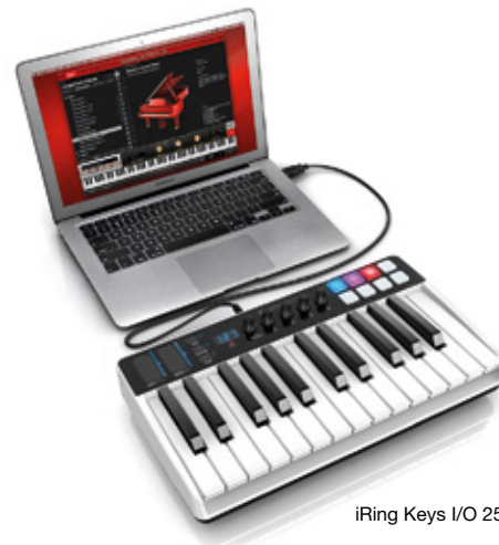
iRig Keys I/O 25.

Soitin-palstalla esitellään kauden kiinnostavia soitinuuksia ja oheislaitteita. Teksti: Tommi Saarela