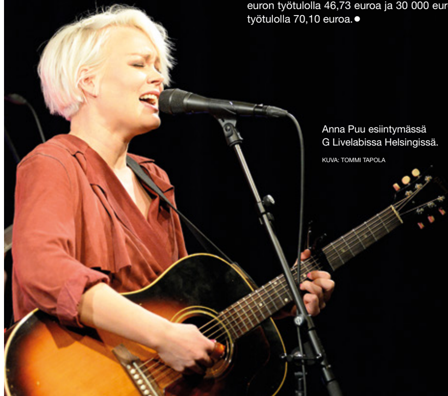
Anna Puu esiintymässä G Livelabissa Helsingissä.