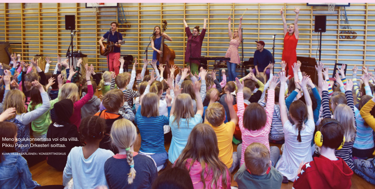
Meno koulukonsertissa voi olla villiä. Pikku Papun Orkesteri soittaa.

Tietoa hakuajoista ja ohjeet: www.musiikinedistamissaatio.fi