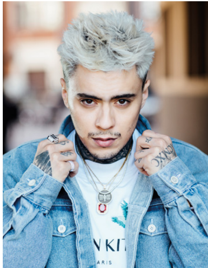
Urani alussa tärkeintä oli päästä tekemään paljon keikkoja, Mikael Gabriel sanoo.