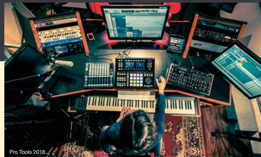
Pro Tools 2018.

Tuoteperheen kolmesta versiosta WL-20 -perusmalli simuloi soinniltaan kolmimetristä kitarakaapelia tuottamalla kapasitatiivisen