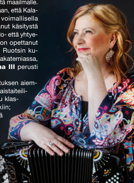
Maria Kalaniemi on muusikon työn ohella tehnyt pitkän uran pedagogina.

Saman kunnianosoituksen aiemmin saaneiden suomalaistaiteilijoiden joukko painottuu klassiseen ja nykymusiikkiin; esimerkiksi säveltäjä Kalevi Aho , Magnus Lindberg ja Kajja Saariaho sekä kapellimestarit Okko Kamu , Susanna Mälkki ja Sakari Oramo .