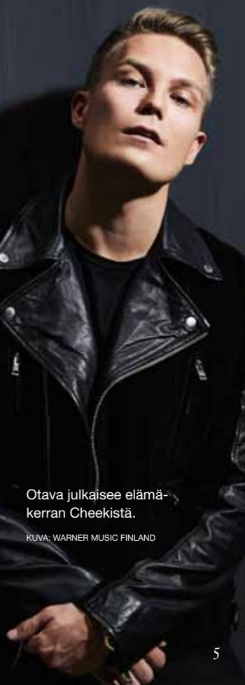
Otava julkaisee elämäkerran Cheekistä.

Kaikista uusista tallenteista, myös radiopromoista, singleistä ja digi- julkaisuista tulee toimittaa ääniteilmoitus Gramexille kuukauden kuluessa julkaisusta. Loppuvuonna 2016 julkaisujen tallenteiden ääniteilmoitukset pitää olla Gramexissa tammikuun 2017 loppuun mennessä. Mikäli vielä on ilmoittamatta aikaisemmin julkaistuja tallenteita, myös näiden ilmoitukset tulee olla silloin Gramexissa. Ääniteilmoituslomakkeet löytyvät kotisivuiltamme www.gramex.fi .