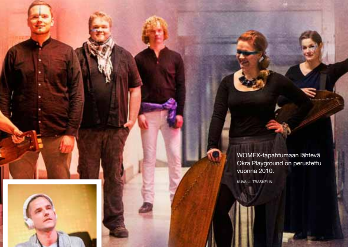
WOMEX-tapahtumaan lähtevä Okra Playground on perustettu vuonna 2010.

Suomalaisyhtye on jälleen valittu tuhansien hakijoiden joukosta WOMEXin showcase-artistiksi. Santiago de Compostelassa järjestettävässä maailmanmusiikin messutapahtumassa esiintyy lokakuussa Okra Playground, joka yhdistää musiikissaan muinaisia ja moderneja äänimaailmoja. Vuonna 2010 perustettu kokoonpano solmi keväällä julkaisusopimuksen saksalaisen Nordic Notes -levymerkin kanssa.