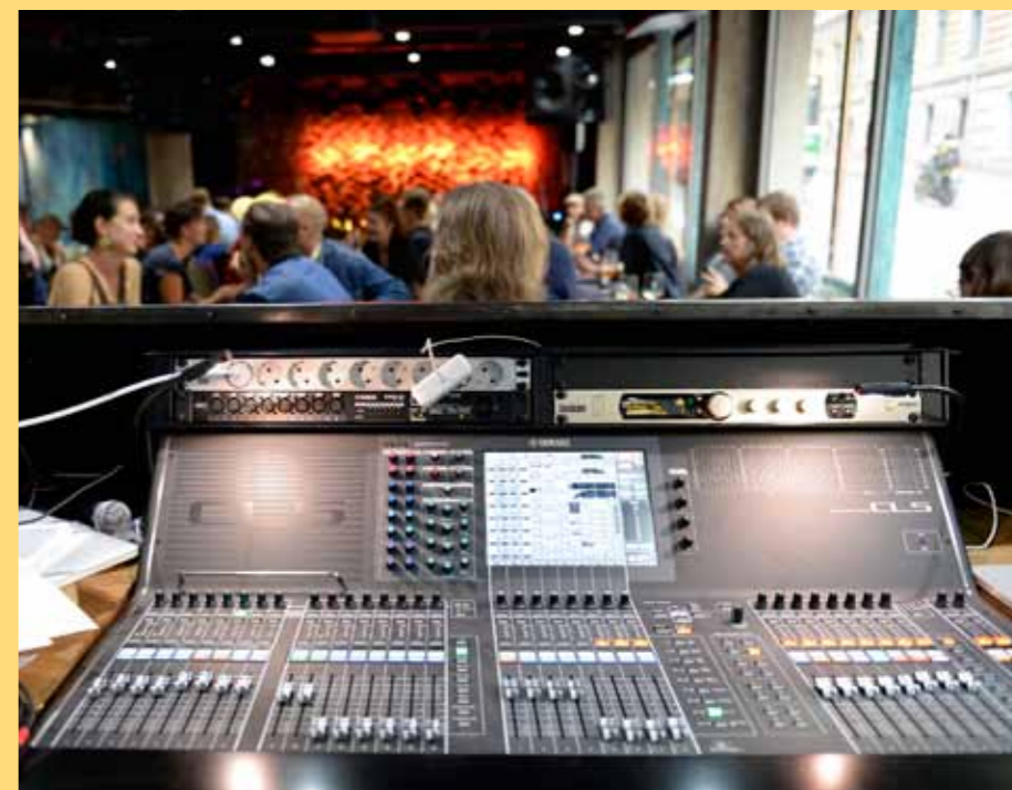
G Livelab satsaa sekä tilaan, laitteisiin että esiintyjien tiloihin.

"Lisäksi on 5.1.-järjestelmä elokuvaäänen toistoon. Sitä voidaan käyttää lavan valkokankaan kanssa."