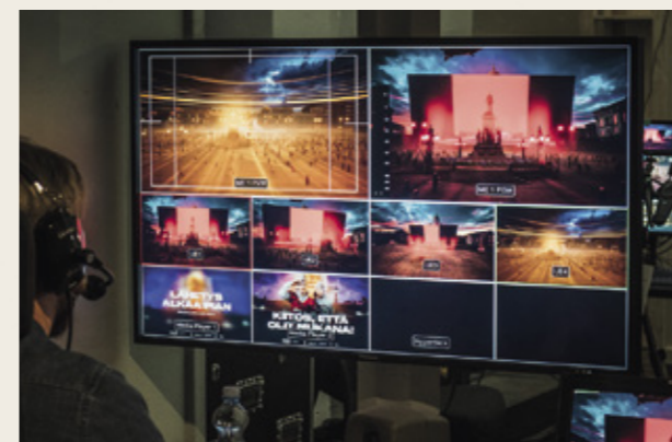
JVG:n Ikuinen vappu -konsertti kuvattiin studiossa vihreää seinää vasten. Kuvaan liitettiin virtuaalinen Senaatintori ja näyttävä vappukeikka keräsi verkossa mittavan yleisön.

ole itsestäänselvyyttä.” Lippujen hintakin voisi elää. ”Pienet intiimit elämykset voivat olla arvokkaampia kuin olla stadionilla kymmenientuhansien joukossa.”