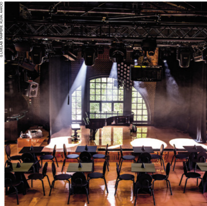
G LIVELAB TAMPERE.