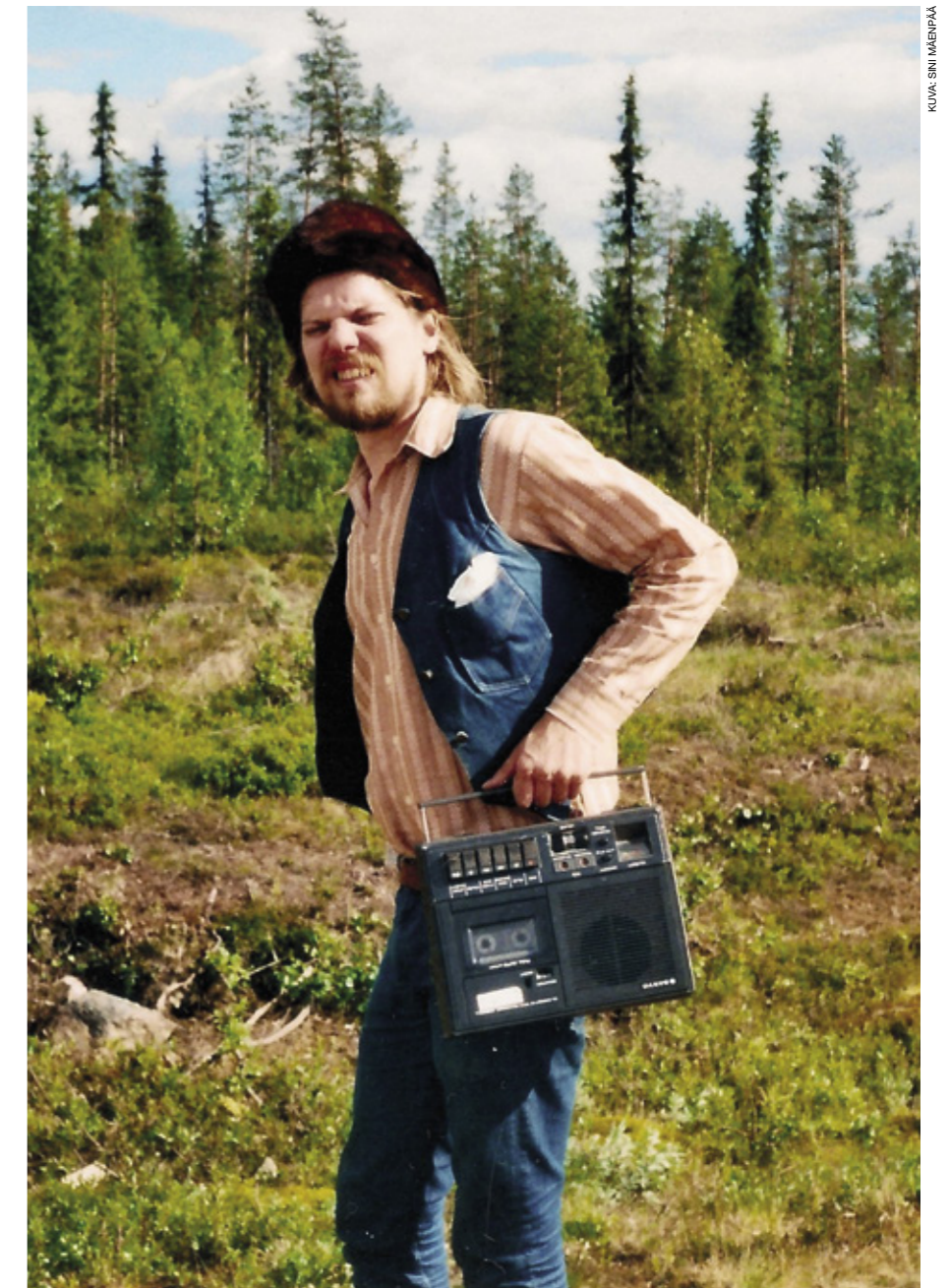
Nousiaisen mukaan on monia bändejä, jotka eivät pidä taloudellista menestystä tärkeänä.