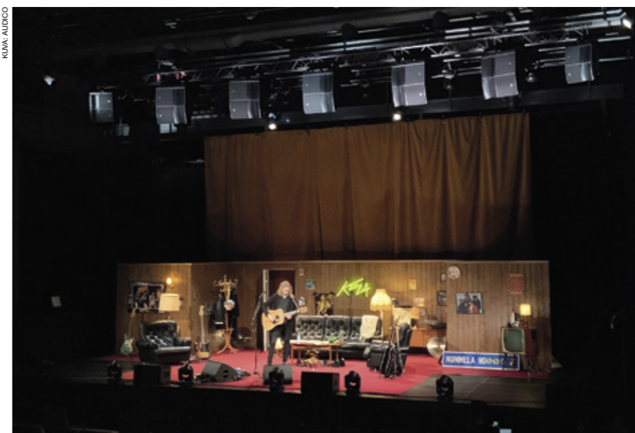
Anssi Kelan keikalla kuuloisteltiin kolmiulotteista live-ääntä.