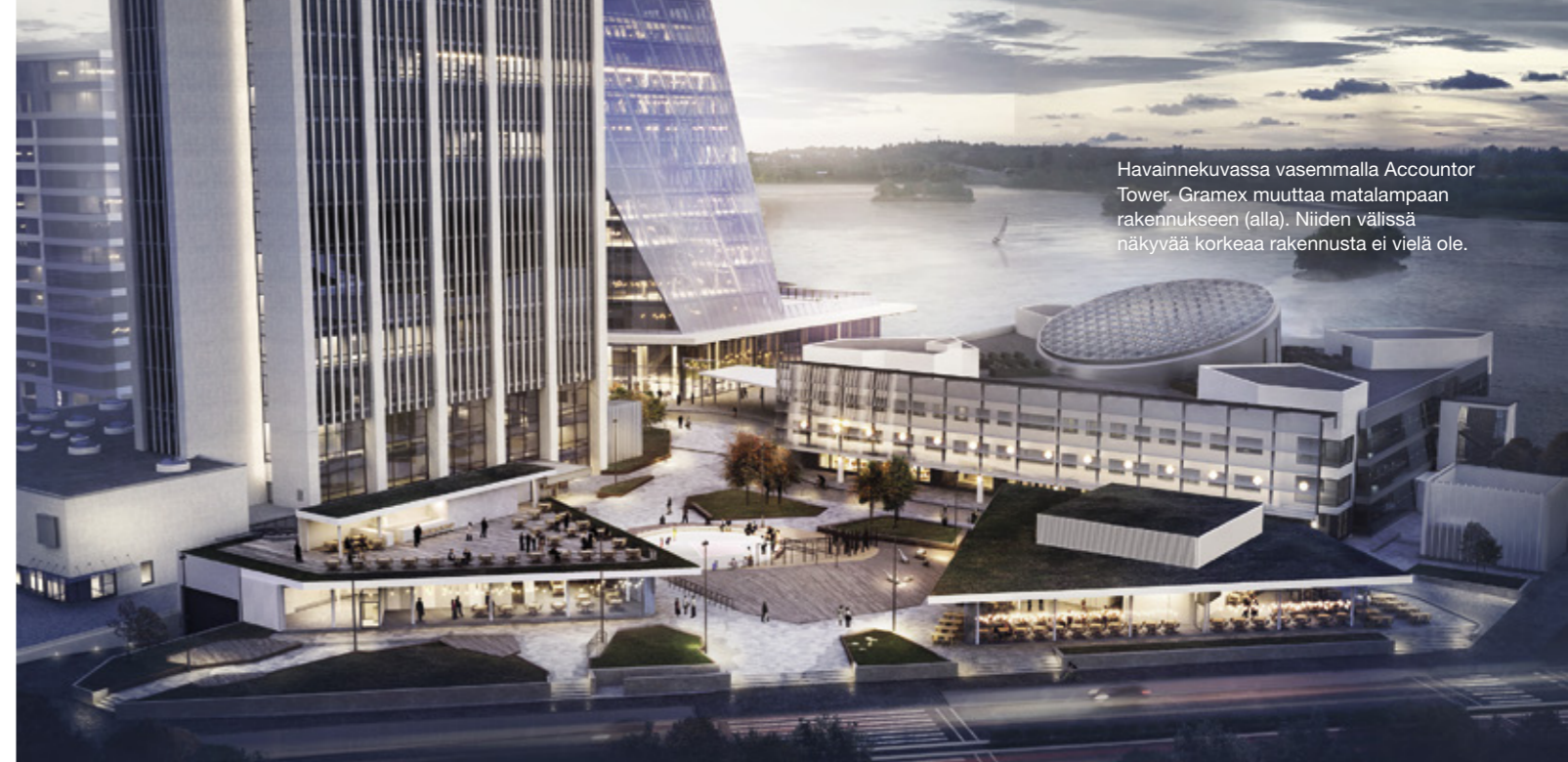
Havainnekuvassa vasemmalla Accountor Tower. Gramex muuttaa matalampaan rakennukseen (alla). Niiden välissä näkyvää korkeaa rakennusta ei vielä ole.

Entä millainen ihminen on Alma, kun päältä kuorii poptähteyden? ”Tosi herkkä tyyppi, nuori isoissa saappaissa, pelokas mutta positiivinen, kaiken kaikkiaan onnellinen ihminen.”●