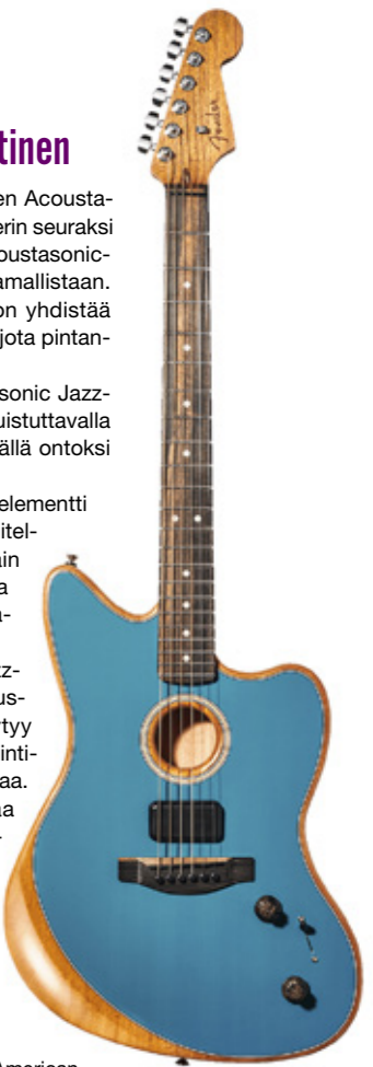
Fender American Acoustasonic Jazzmaster.