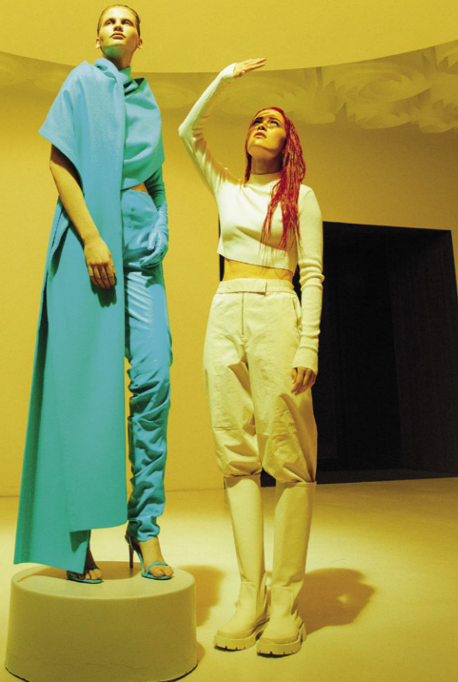
Korona-aika sai Sannin tarkastelemaan itseään ja elämäänsä uudella tavalla.

”Luovan kauden aikana näen biisinaiteita kaikkialla. Kun levyn materiaali on valmiina, tuo ikkuna sulkeutuu ihan tiedostetusti: en katsele maailmaa enää biisinaiteina vaan sellaisena kuin se on. Levyjen välissä pitää elää elämää, jotta on kokemuksia, joita voi myöhemmin tarkastella biiseissä, todellisuuden osasina ja laineina.”