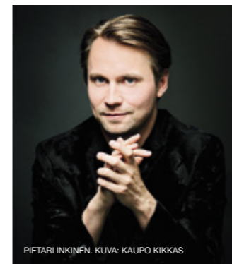
PIETARI INKINEN.

Yhteispohjoismainen Roots & Sync -hanke yhdistää kansanmusiikin tekijät sekä music supervisorit ja synkronointiagentit, jotka etsivät musiikkia elokuviin, tv-sarjoihin, mainoksiin ja peleihin. Artistit ja heidän edustajansa voivat lisätä hankkeen sivustolle tietoja ja musiikkinäytteitä. ●