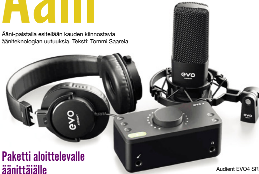
Audient EVO4 SRB.

Ääni-palstalla esitellään kauden kiinnostavia ääniteknologian uutuuksia. Teksti: Tommi Saarela