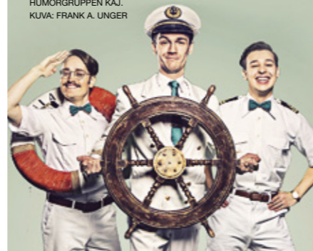
HUMORGRUPPEN KAJ.

Kajin edellinen musikaali, pohjanmaalaiselle paikallispatriotismille irvaileva Gambamärk myi Wasa Teaterissa 23 000 lippua vuonna 2019. Ryhmän 10-vuotiskonsertti keräsi 8 000 kuulijaa Botnia-halliin viime keväänä. ●