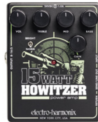
Electro Harmonix Howitzer.