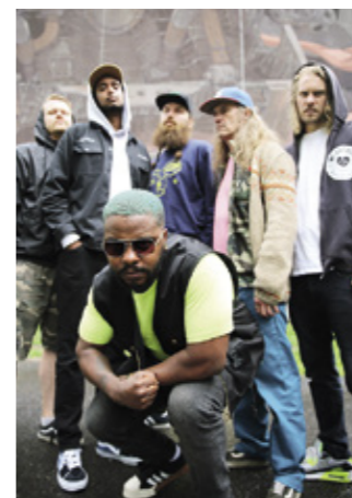
LÄHIBOTOX ON HELSINKILÄINEN RAP METAL -YHTYE, JOKA ESINTYY NUMMIROCKISSA.

Kauhajoen Nummirock järjestetään tulevana kesänä viimevuotiseen tapaan kokonaan virtuaalisena. Samalla se on Vevent-hankkeen pilotti. Tavoite on hankkia osaamista, tietoa ja verkostoja virtuaalitapahtumien tuottamiseen. Festivaalin ilmaisia ja maksullisia livestriimikeikkoja ja oheisohjelmaa pääsee katsomaan omalla avatar-hahmolla. Tapahtuma järjestetään 25.–26. kesäkuuta. ●