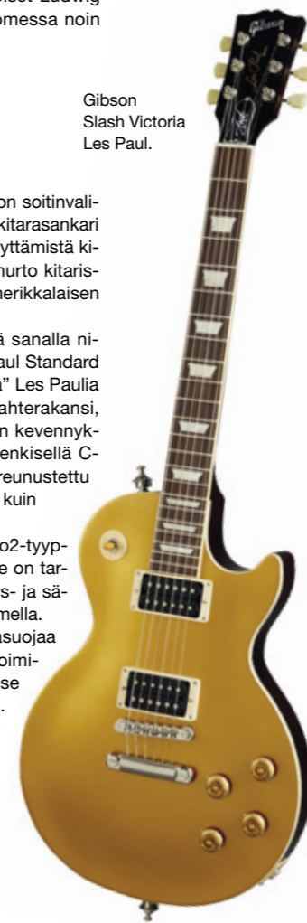
Gibson Slash Victoria Les Paul.