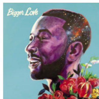
JOHN LEGENDIN ALBUMIN BIGGER LOVE JULKAISI COLUMBIA RECORDS.