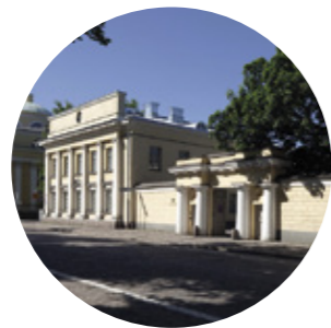
TAITEIDEN TUTKIMUS SUIJUTTUU TOPELA-KORTTELIN UNIONINIKAKADULLA.

Egotrippi-yhtyeestä tuttu Knipi , oikealta nimeltään Zachris Stierncreutz , julkaisi toukokuussa singlen 00840 . Nimi juontuu Helsingin Laajasalon saaren postinumerosta. Kappale on kunnianosoitus kotikulmille ja parisuhteelle, joiden arvo ja merkitys korostuu korona-aikana. Samalla se on ylistys jokaisen omalle kotiseudulle tai naapurustolle, Knipi sanoo. ●