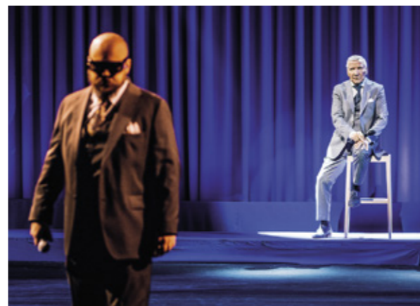
Pyhimys (vas.) ja Eino Grön esittivät yhdessä uuden kappaleen Hyvät hautajaiset. Se julkaistiin Gaalan jälkeen.

”Juhlimme suomalaista musiikkia ja oli kuitenkin hyvä, että Gaala järjestettiin. Parempi näin, kuin ettei olisi järjestetty mitään. Suomalainen musiikki on niin omaansa, että sitä on syytä juhlaa laadukkaasti ja ajan hengessä.”