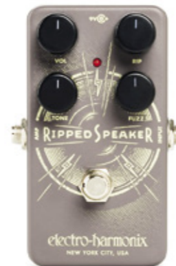
Electro Harmonix Ripped Speaker.