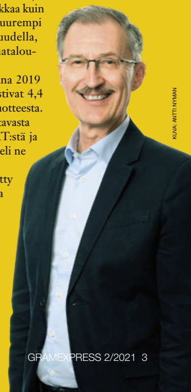
KUVA: ANTTI NYMAN