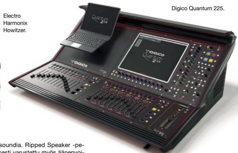
Digico Quantum 225.

on varustettu efektikenkillä, jonka Send-liitäntä sopii myös linjalähdöksi pedaalin etuasteelle.