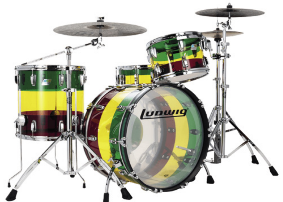
Ludwig Vistalite Island Sunset.