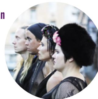
SUISTAMON SÄHKÖ ON MUKANA ROOTS & SYNC -HANKKEESSA.

Kapellimestari Pietari Inkinen on valittu kolmeksi vuodeksi Etelä-Korean radion sinfoniaorkesterin musiikilliseksi johtajaksi tammikuusta 2022. Hän jatkaa myös Deutsche Radio Philharmonie Saarbrücken Kaiserslauternin ylikapellimestarina ja Japanin filharmonikkojen ylikapellimestarina. ●