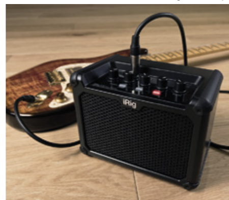
iRig Micro Amp.