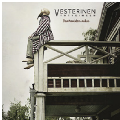
Maaliskuussa julkaistiin yhtyeen uusi levy Faaraiden aika.