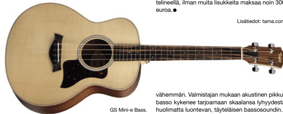
GS Mini-e Bass.