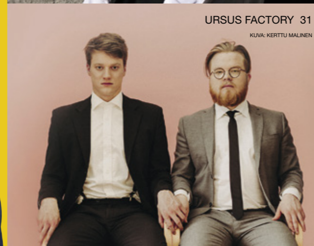
URSUS FACTORY 31