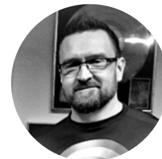
WEMPPA KOIVUMÄKI, JARKKO NORDLUND