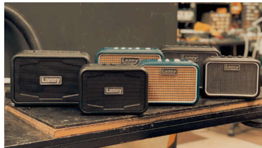
Mini Laney -sarja.

Soitin-palstalla esitellään kauden kiinnostavia soitinuuksia ja oheislaitteita. Teksti: Tommi Saarela