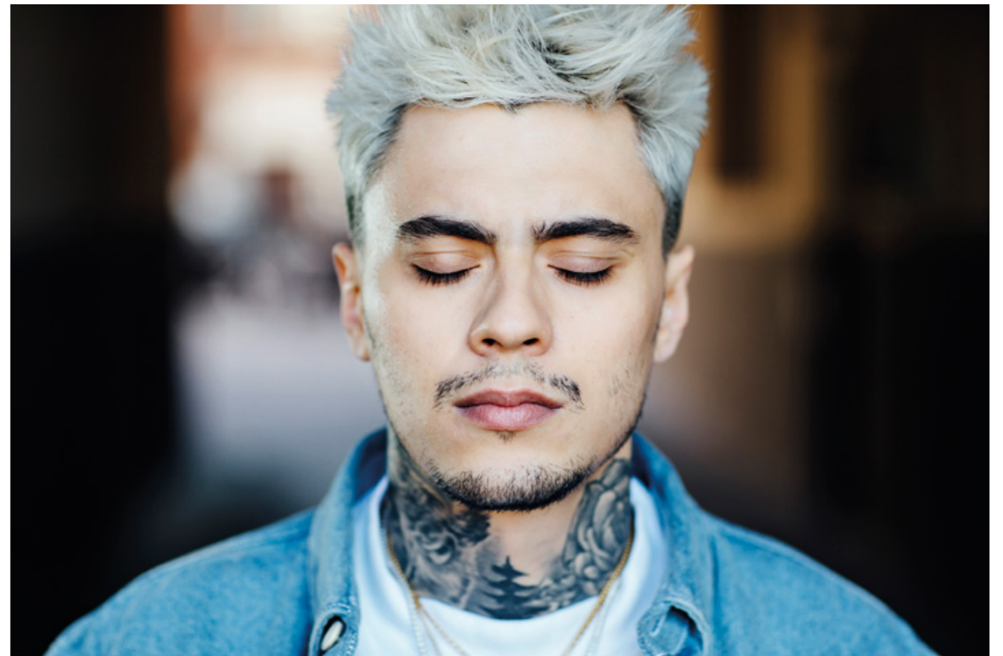
Mikael Gabriel uskoo, että monilla on hänestä väärä mielikuva: ”Ainakin juorulehtien perusteella. Mutta niissä lähtökohta onkin täysin väärä”.

”Mähän olen lähtökohdiltani malmilainen kundi, jolla ei ole ollut nuoruudessaan yhtään mitään. Nyt kun mulla on mahdollisuus saada jotain, niin tavallaan ylläluuan kaikkea mahdollista”, Mikael Gabriel kertoo elämäntyylistään.