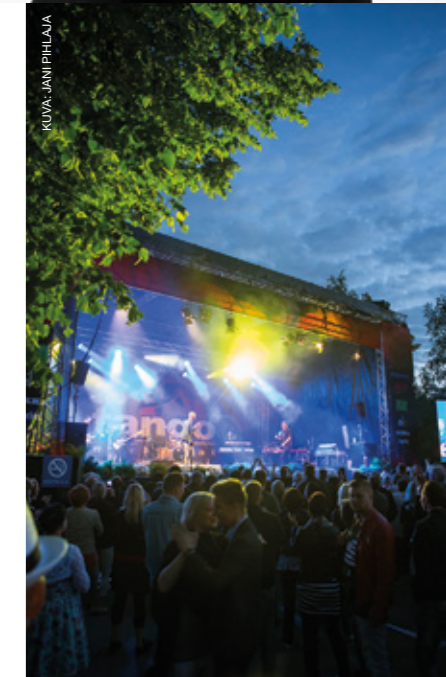
Sävellys- ja sanoituskilpailu on yksi Tangomarkkinoiden neljästä kilvasta.