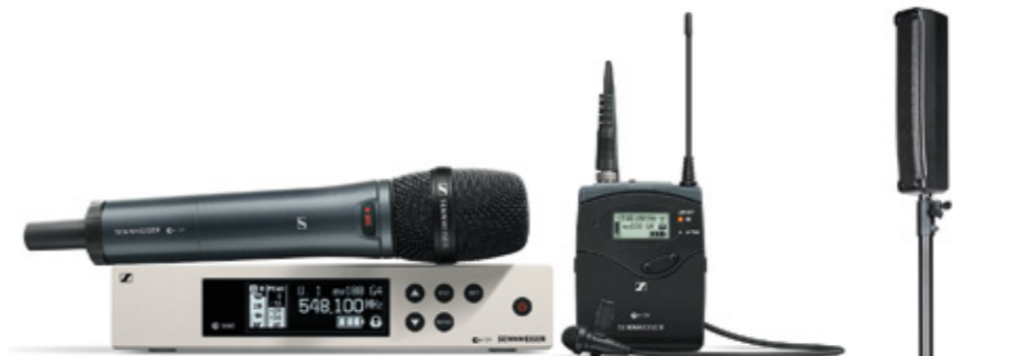
Evolution Wireless G4.