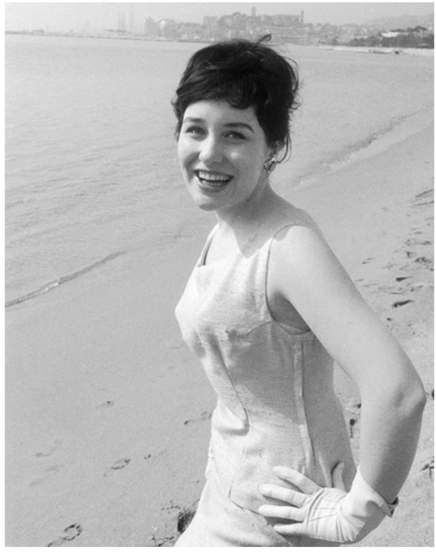
Suomen ensimmäinen euroviisuedustaja Laila Kinnunen kilpailupaikalla Cannesissa vuonna 1961. Kappale Valoa ikkunassa päätyi sijalle kymmenes 16 kilpailijan joukossa.