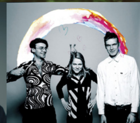
Värttina, Noah Kin ja Mopo osoittavat maailmalla, että suomalainen musiikki kattaa monta eri lajia ja tapaa tehdä musiikkia.