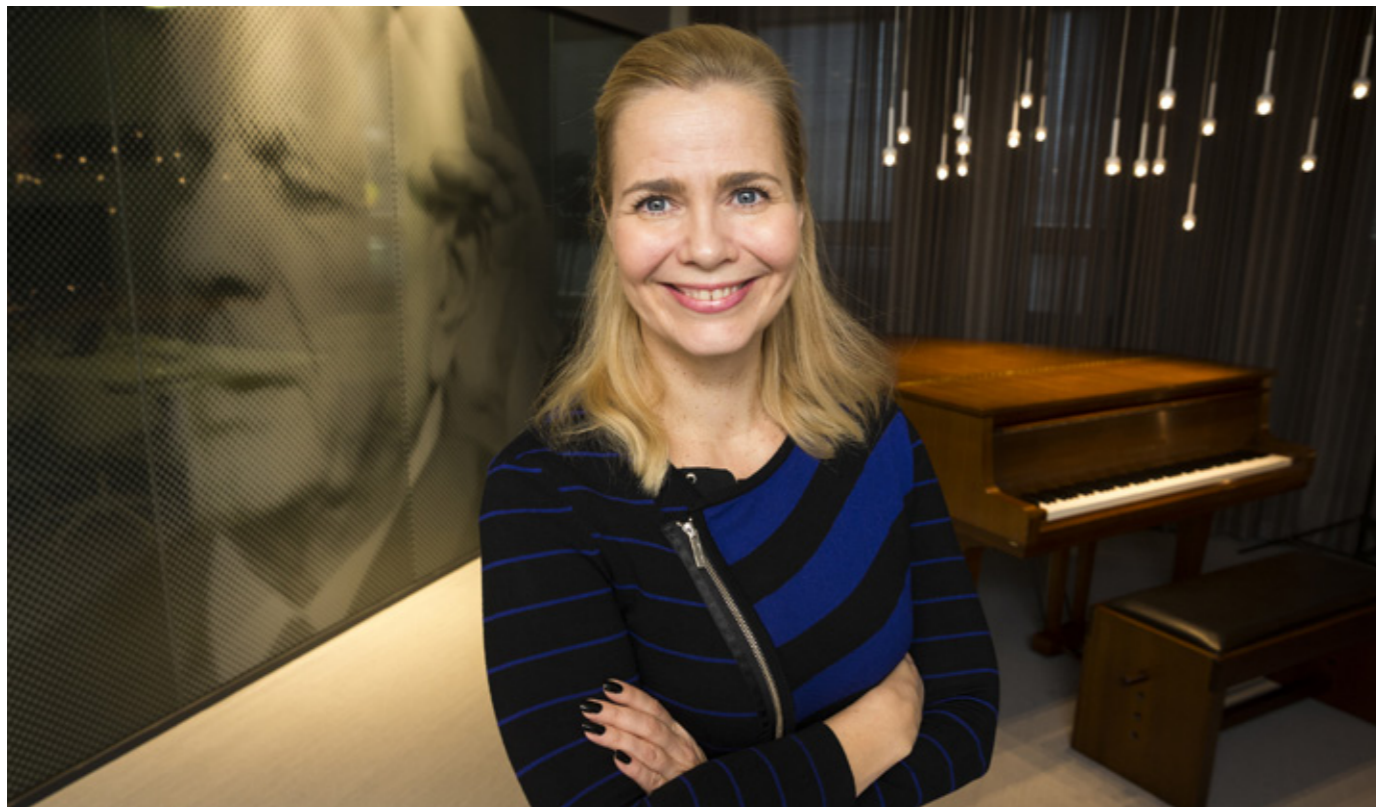
Uusi yhtiö yhdistää parhaat puolet kahdesta vahvasta palvelukanavasta, henkilökohtaisesta ja verkkopalvelusta.