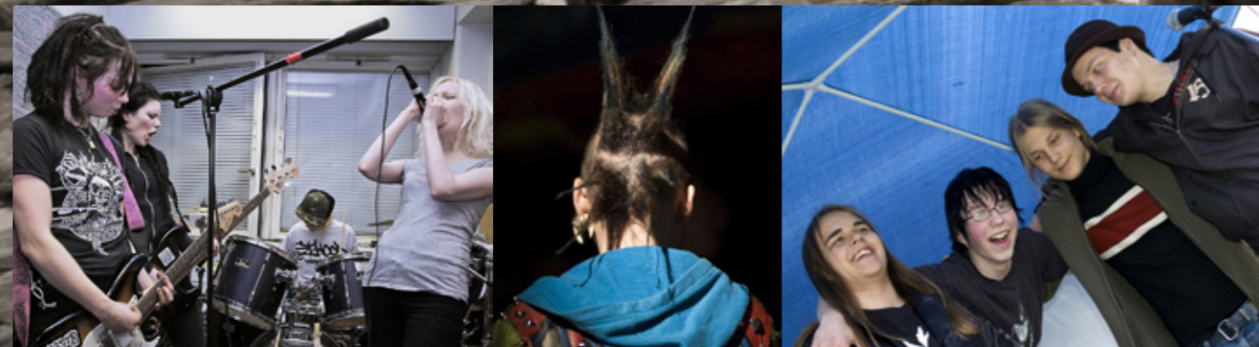
Punk – tauti joka ei tapa -elokuvassa olivat mukana muun muassa yhtyeet Creepy Crawlies (vas.) ja Akupunktio.