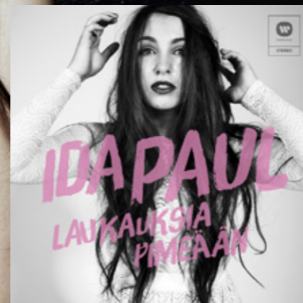
Ensimmäinen single Laukauksia pimeään julkaistiin tammikuussa 2016.

”Yleensä saan inspistä hetkistä, jolloin koen jotain voimakasta tunnetta, oli se sitten suru, viha, rakkaus tai mikä tahansa muu. Yritän miettiä miltä minusta tuntuu ja pukea tunteen sanoiksi niin, että muutkin ymmärtäisivät sen. On palkitsevaa, kun jotain perustunutta onnistuu kuvailemaan uudella tavalla.”