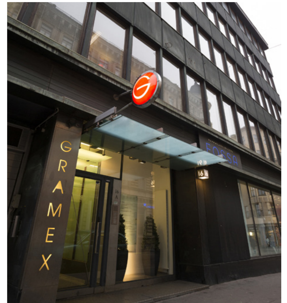
Gramex edustaa yli 50 000 kotimaista muusikkoa ja äänitetuottajaa sekä lukemattomia ulkomaisia.

Tekijänoikeudet ovat joka puolella läsnä ihmisen arjessa.