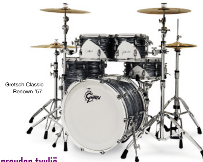
Gretsch Classic Renown '57.