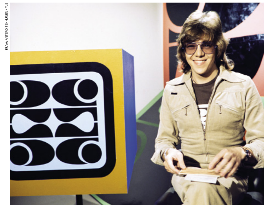
Mikko Alatalo tuli musiikkidiggareille tutuksi 1970-luvun alussa Ylen musiikkiohjelma Iltatähden pirtsakkana juontajana.