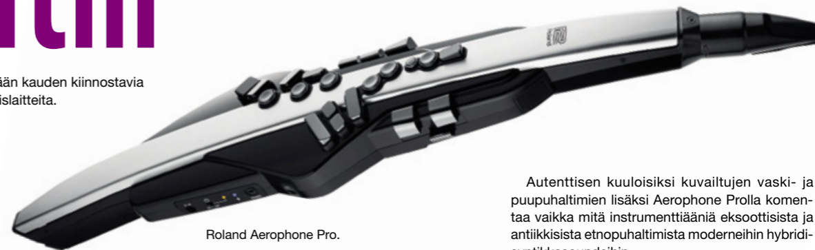
Roland Aerophone Pro.

Soitin-palstalla esitellään kauden kiinnostavia soitinuuksia ja oheislaitteita. Teksti: Tommi Saarela