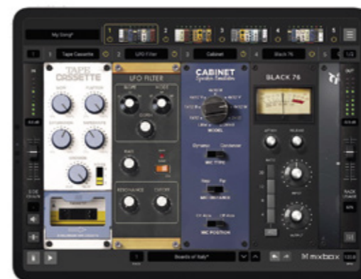
IK Multimedia MixBox CS.