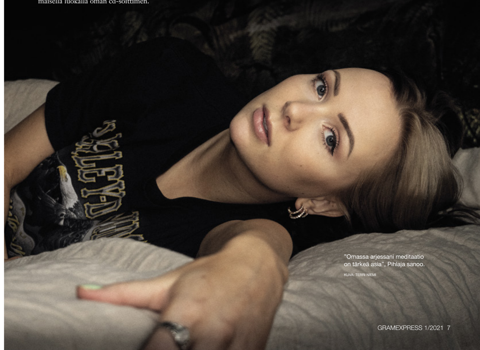
”Omassa arjessani meditaatio on tärkeä asia”, Pihlaja sanoo.