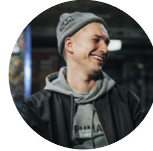
ASA MASA