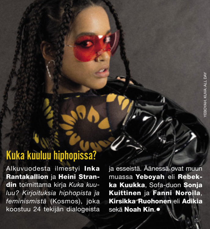
YEBOVAH, KUVA: ALL DAY

Teksti: Riikka Hiltunen, Heikki Jokinen ja Lauri Kaira