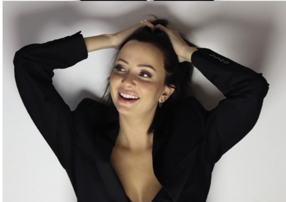
Pihlaja sanoo halunneensa haastaa perinteisiä sukupuolirooleja viime lokakuussa julkaistulla esikoisalbumillaan Kirjoitettu tähtiin .

”Se oli tosi siisti juttu, en ollut sellaista noteerausta osannut odottaa.”