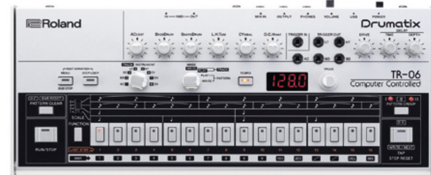
Roland Drumatix TR-06.