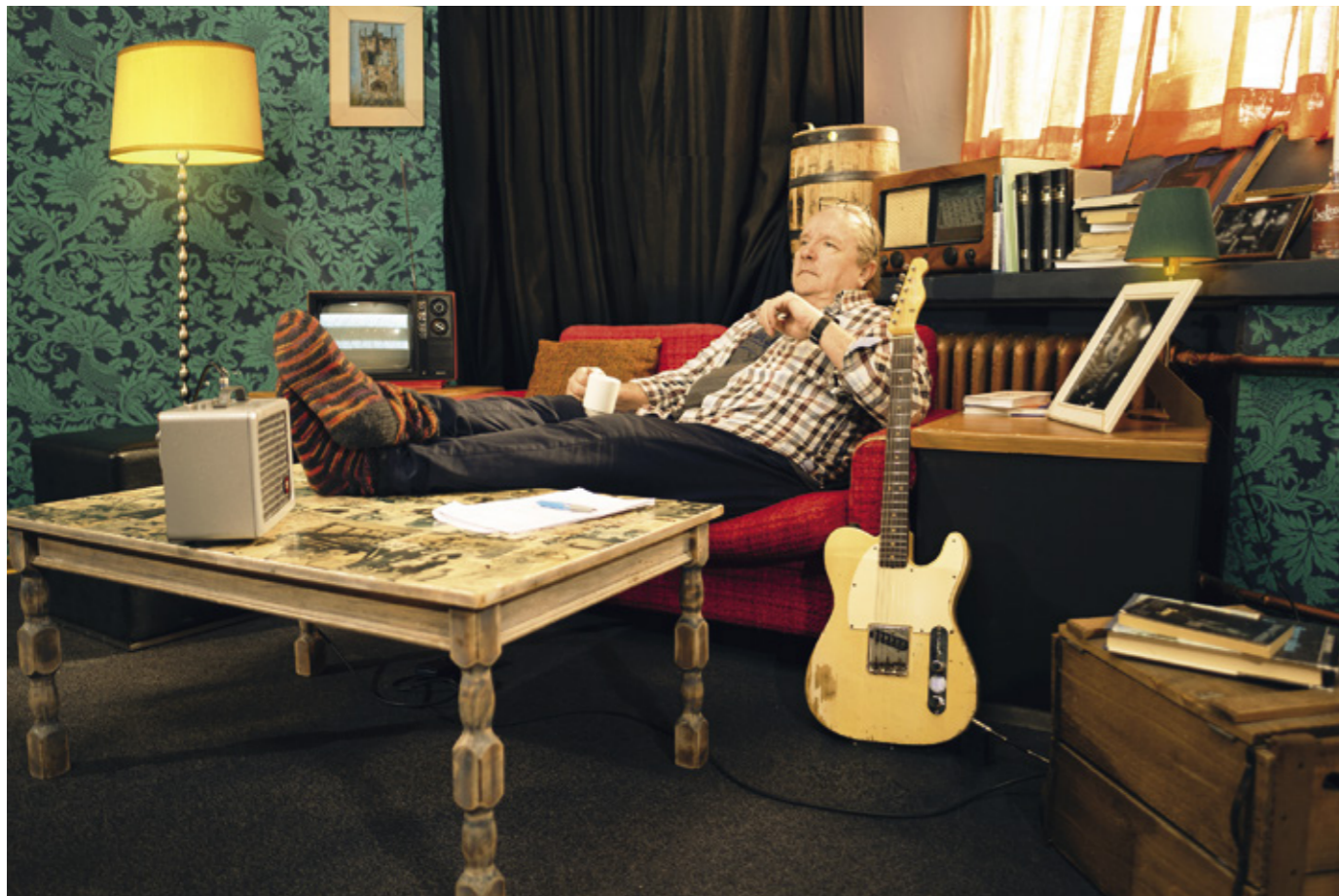
Monikasvoinen taiteilijapersoonaa tunnetaan myös näyttelijänä. Kuosmanen on esiintynyt parissakymmenessä kokoillan elokuvassa.