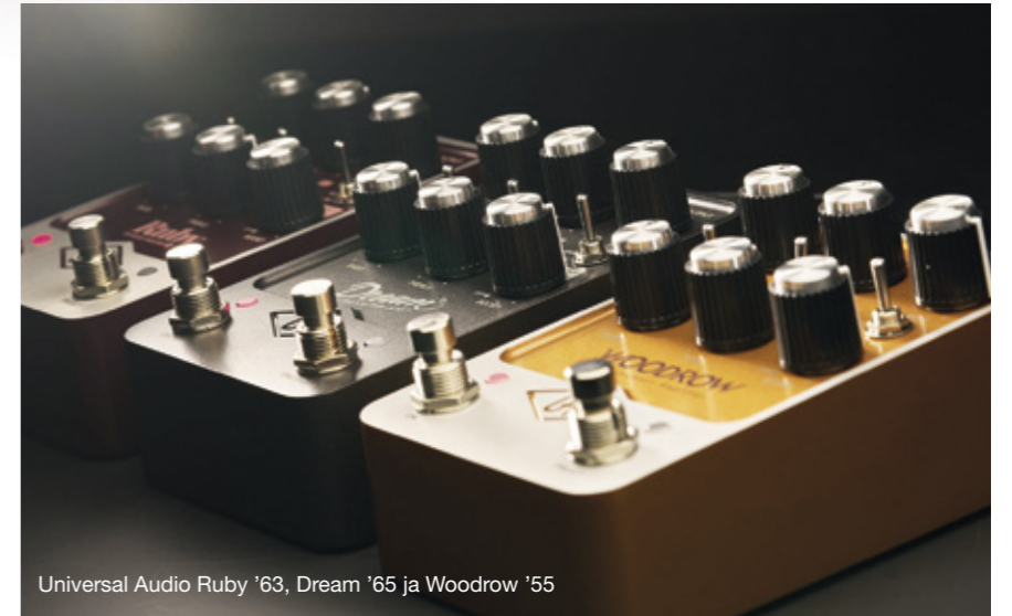
Universal Audio Ruby '63, Dream '65 ja Woodrow '55