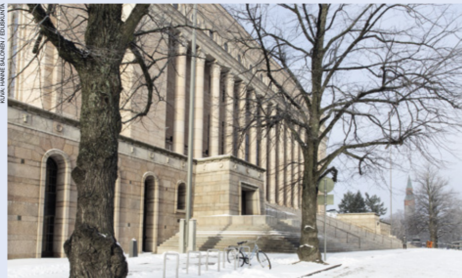
EU:n tekijänoikeusdirektiivien implementointi on ollut mutkikas polku, mutta nyt eduskunta on työn loppusuoralla.

Myös Risikko näkee tärkeäksi, että asiaan puututaan. ”Ongelma on ilmeinen. Hyvä on löytää oikeudenmukainen ratkaisu.” ●