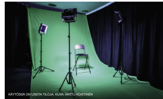
KÄYTÖSSÄ ON USEITA TILOJA.

B. B. Kingin mukaan. Gaala järjestetään tammikuussa Torontossa. Lytinen julkaisi juuri uusimman albuminsa Waiting for the Daylight (Tuohi Records). ●