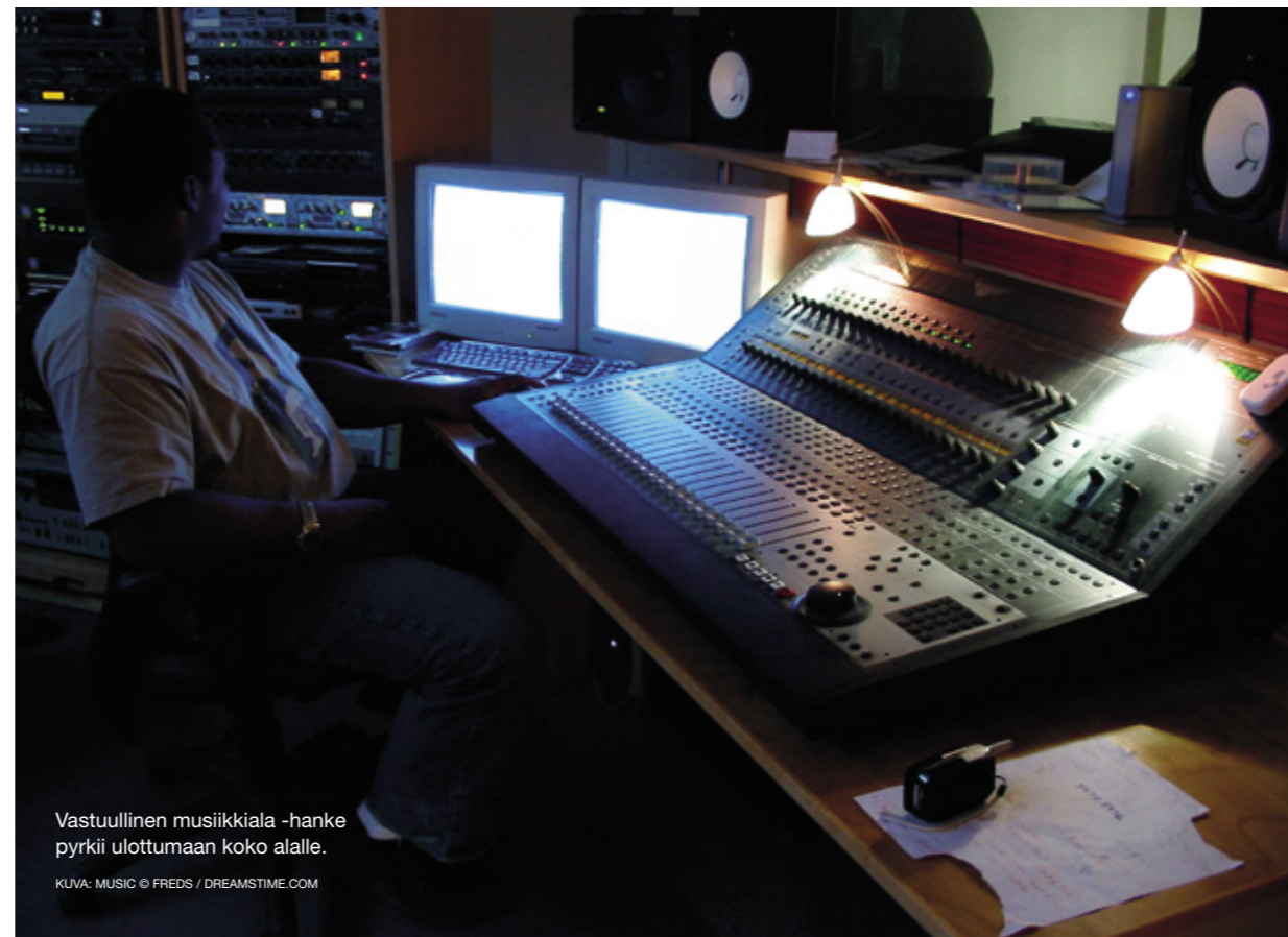
Vastuullinen musiikkiala -hanke pyrkii ulottumaan koko alalle.

Lipun ostaminen keikalle on sekin sopimus, Kahilainen sanoo. ”Musiikkitapahtumilla on jo arvot ja säännöt, joiden mukaan osallistujien tulee toimia.”●