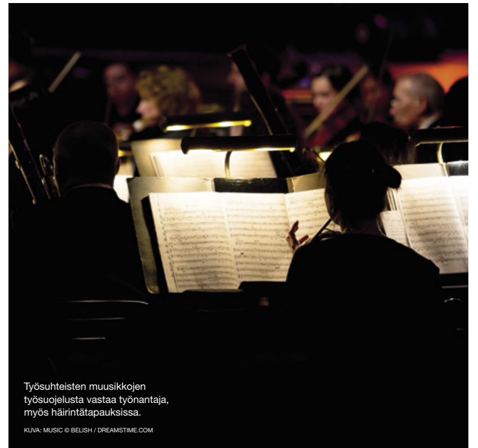
Työsuhteisten musiikkojen työsuojelusta vastaa työnantaja, myös häirintätapauksissa.