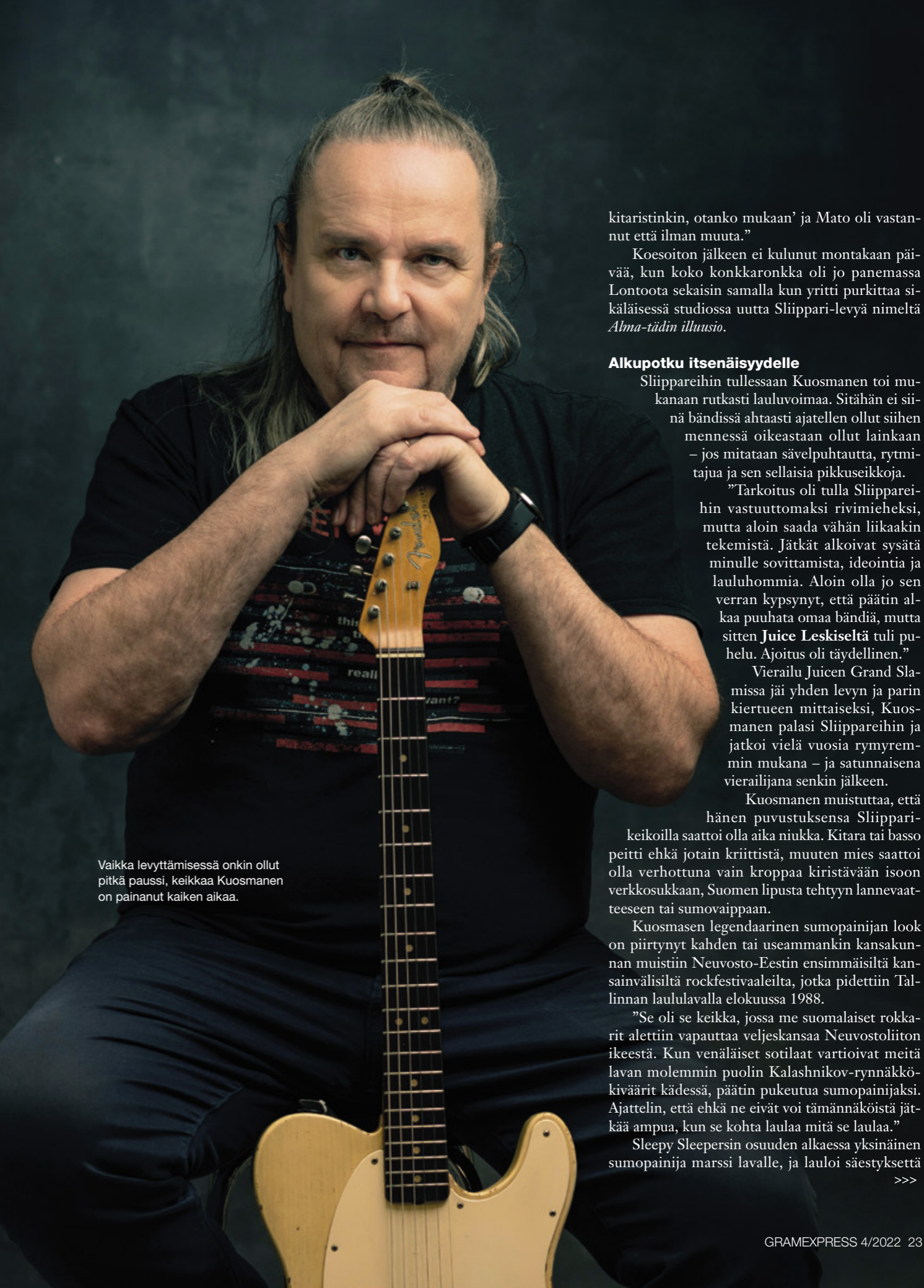
Vaikka levyttämisessä onkin ollut pitkä paussi, keikkaa Kuosmanen on painanut kaiken aikaa.

”Innostuin jutusta. Hate soitti Madolle, että ’oon lähössä junalle, ja oon löytänyt