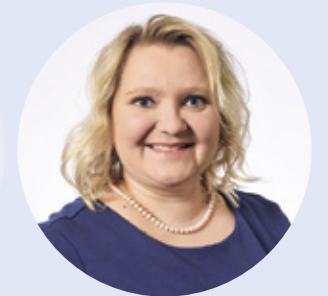
Eduskunnan valiokuntien puheenjohtajat Johanna Ojala-Niemelä, Paula Risikko ja Suna Kymäläinen pyrkivät kaikki siihen, että tekijänoikeusdirektiivit sisällytetään asianmukaisesti Suomen lakiin.