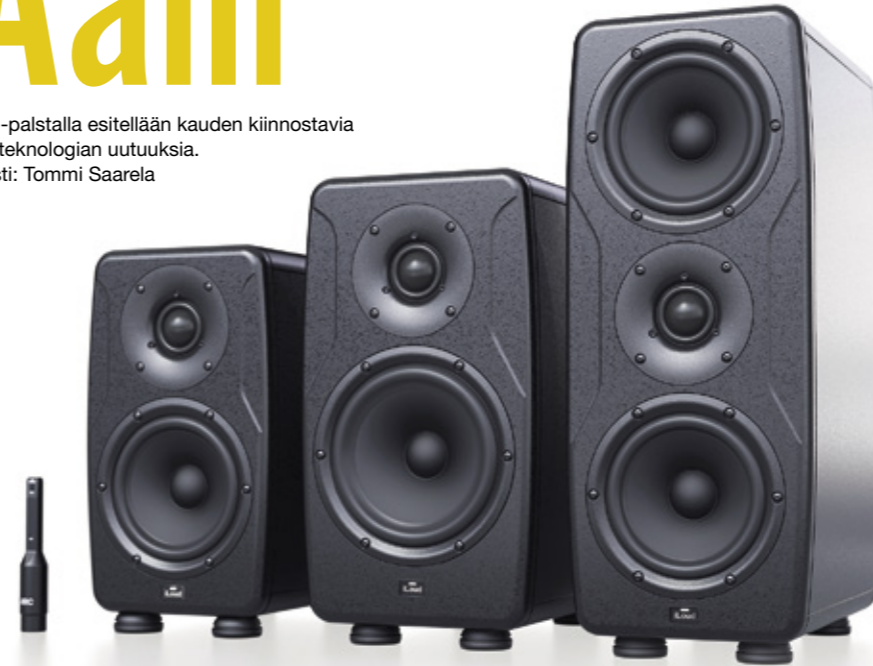
IK Multimedia iLoud Precision

Ääni-palstalla esitellään kauden kiinnostavia ääniteknologian uutuuksia. Teksti: Tommi Saarela