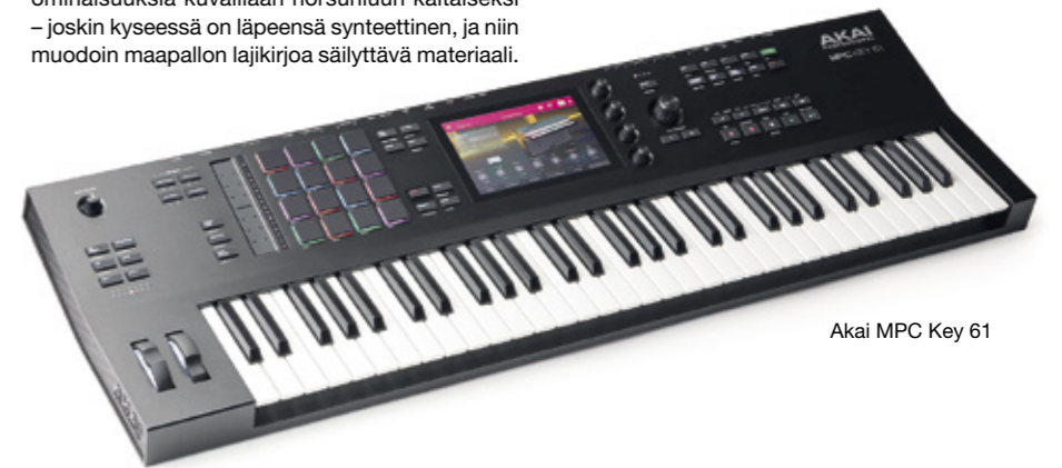
Akai MPC Key 61