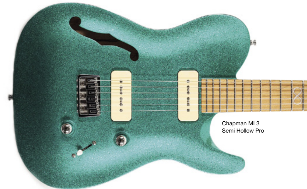
Chapman ML3 Semi Hollow Pro