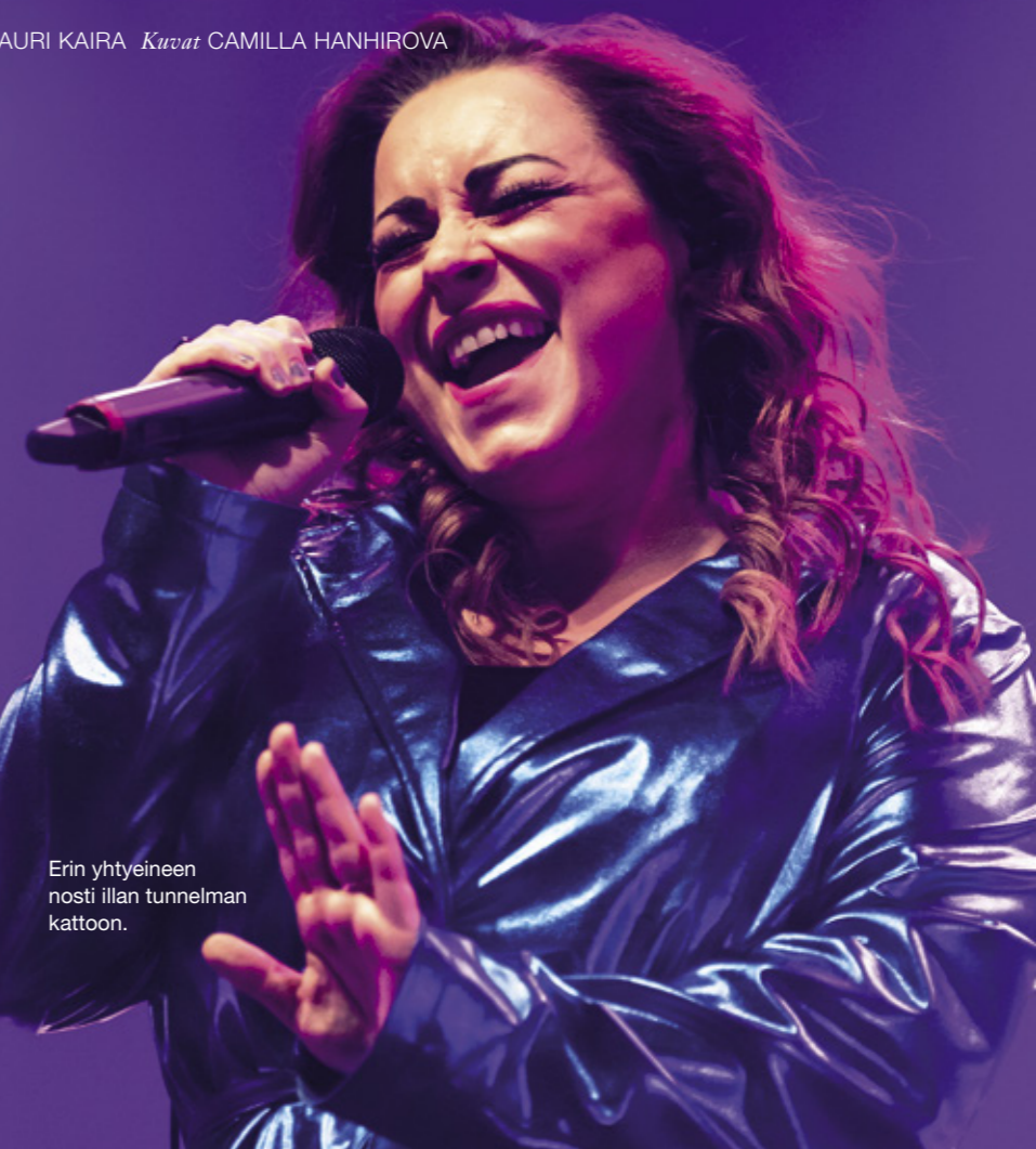
Erin yhtyeineen nosti illan tunnelman kattoon.

”Kaikkia meitä yhdistää rakkaus musiikkiin ja se, että haluamme yhdessä luoda pohjaa musiikin menestykselle Suomessa.”